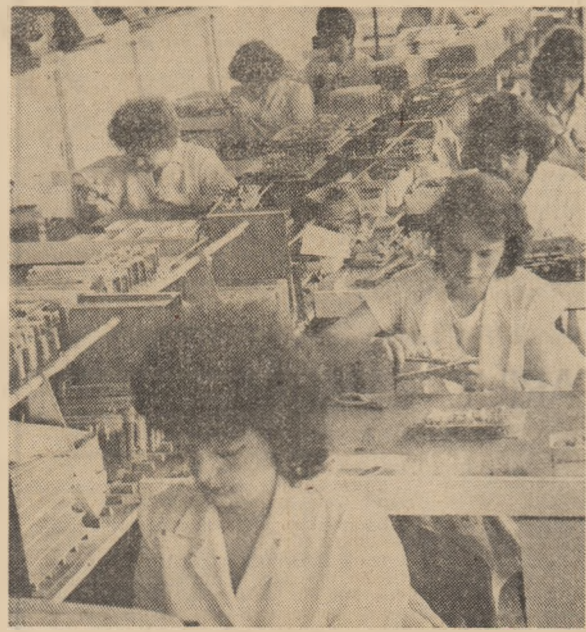
Aspect de muncă la Intreprinderea „Electrotehnica” din București