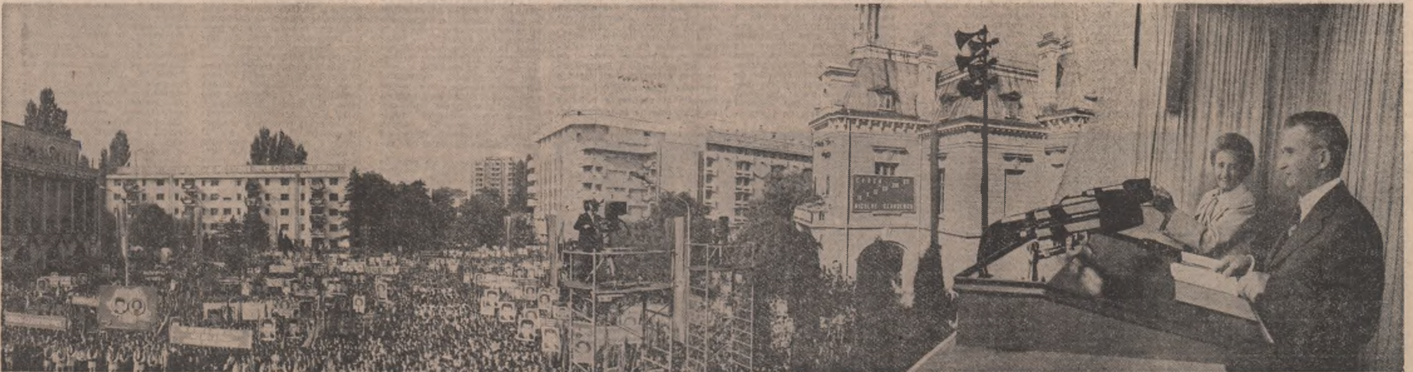
Tovarășul Nicolae Ceaușescu, secretar general al Partidului Comunist Român, prezidentele Republicii Socialiste România, împreună cu tovarășa Elena Ceaușescu au continuat, luni, vizita de lucru în județul Botoșani.