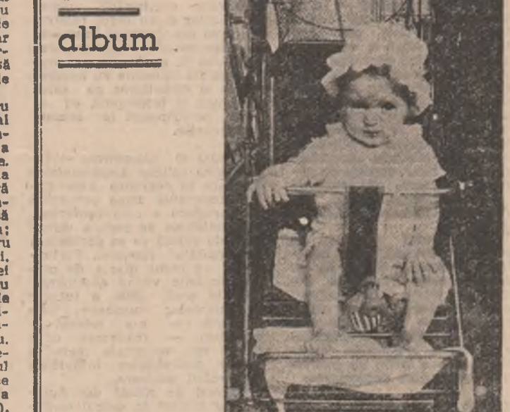
Înainte primilor pași