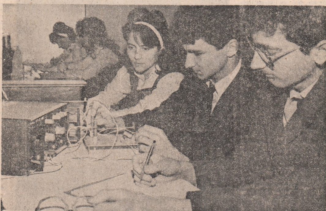
Disciplină, seriozitate, înaltă ținută științifică și profesională — iată doar cîteva din atribuțiile tineretului studios, ale celor ce își manifestă în aceste zile, prin fapte de muncă și învățătură exemplară, profundă recunoștință față de măsurile cuprinse în recentul Decret al Consiliului de Stat referitoare la majorarea cu 10 la sută a burselor ce se acordă studenților și elevilor.

În spiritul sarcinilor trasate de tovarășul Nicolae Ceaușescu la ședința