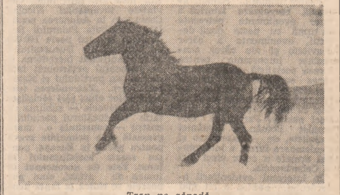
Trap pe zăpădă...