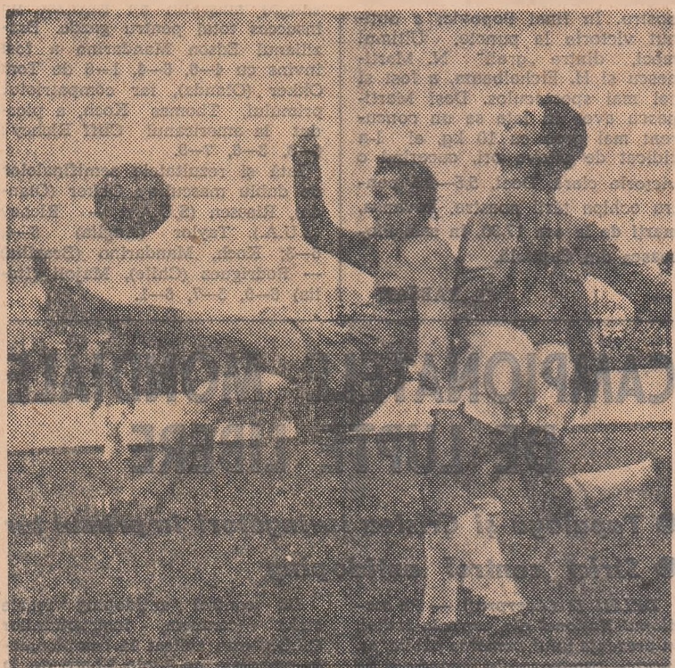
Fază din meciul Metalul București — Ceahlăul Piatra Neamț.