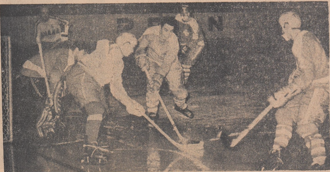
Din nou, echipa noastră în atac. Și această acțiune se va solda cu un gol