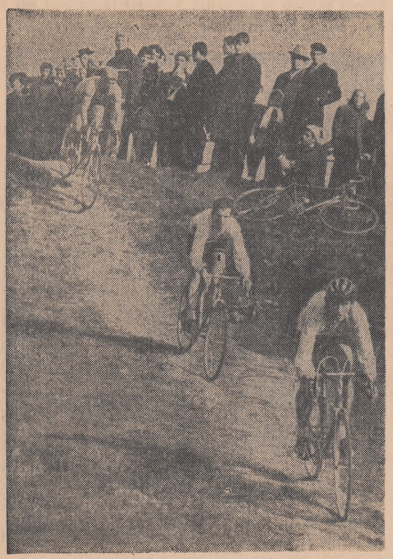
Coborîre pe una din pante... (Citiți în pag. a 2-a cronică campionatului republican de ciclocros)