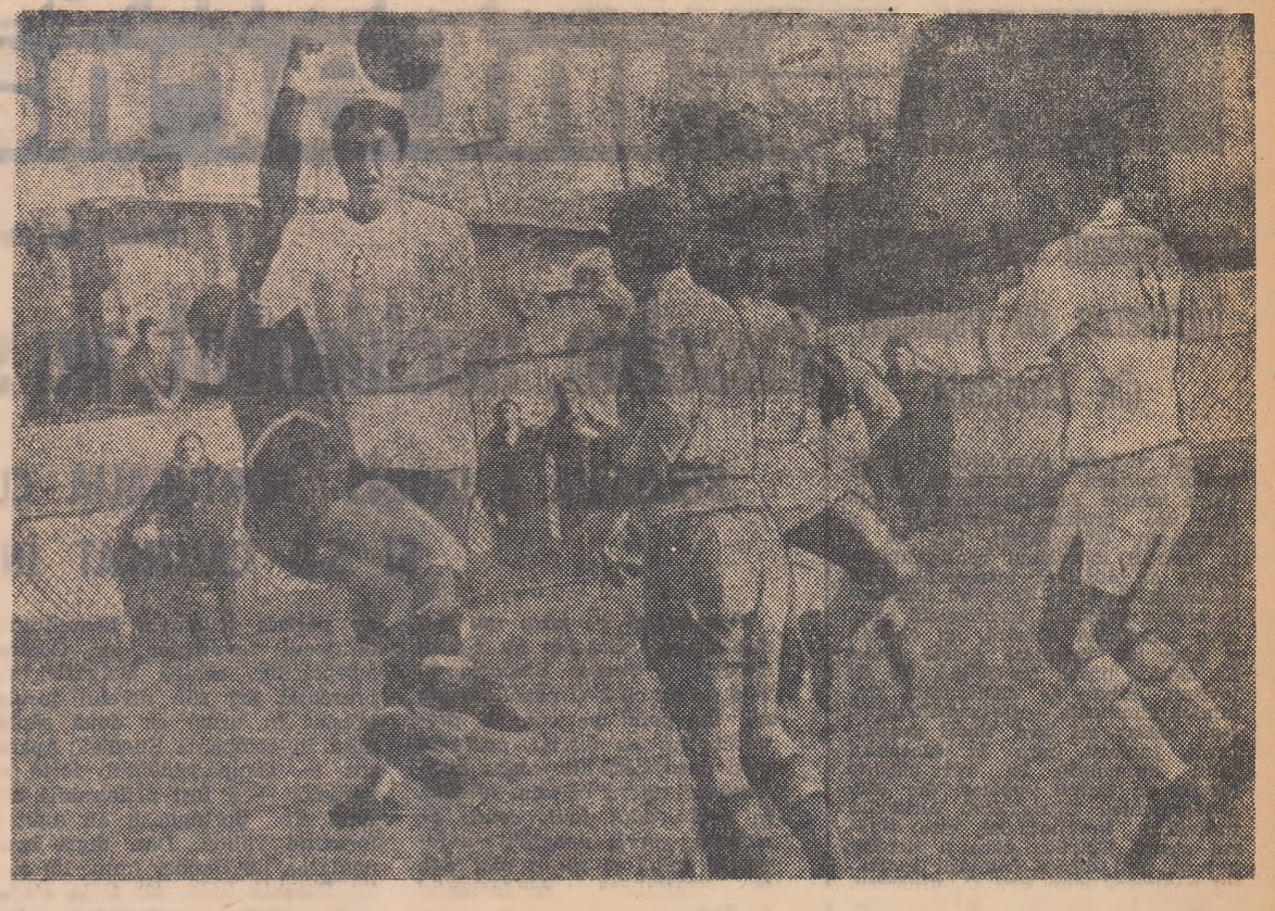
Una dintre acțiunile ofensive ale oborenilor la poarta echipei brașovene. (Fază din meciul Electronica Obor — Metrom Brașov)

CLASAMENT 1. C.S.M.S. Iași 13 3 13 20 9 19 2. Ceahlău P. N. 13 7 2 18 20 16 3. Electronica, Obor 13 6 4 3 25 20 4. Metalul Buc. 13 6 3 12 9 15 5. Siderurg. Galați 13 6 2 5 19 14 6. C.F.R. Pașcani 13 6 1 6 19 13 7. Poiana Cimpina 13 6 1 6 18 13 8. Metrom Brașov 13 5 2 6 15 12 9. Chimia Suceava 13 5 2 6 15 12 10. Portul C.A. 13 5 2 6 14 12 11. Flacăra Moreni 13 5 1 15 18 11 12. Victoria Roman 13 5 1 12 17 11 13. Politehnica Buc. 13 5 0 16 16 9 14. Chimia R. Vilcea 13 4 1 8 20 9