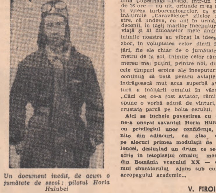
Un document inedit, de acum o jumătate de secol: pilotul Horia Hulubei