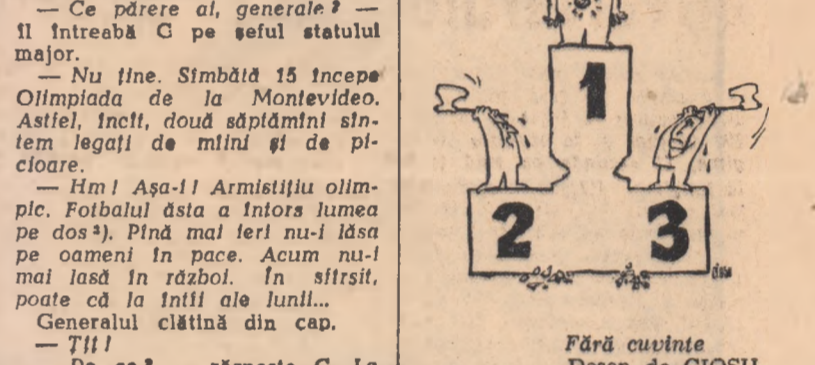
Fără cuvinte Desen de CIOSU