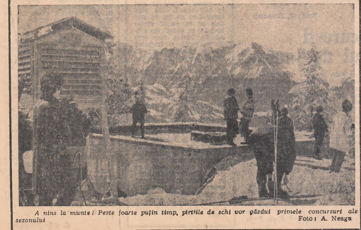
A nins la munte! Peste foarte puțin timp, pîrțile de schi vor găzdui primele concursuri ale sezonului

Deținătoarea autoritară a „C.C.E.” la tenis de masă masculin, C.S.M. Cluj, va susține primul meci, în actuala ediție, la 22 decembrie, la Cluj. Partida va avea loc în compania campioanei Poloniei, Spojnia Varșovia, și va conta pentru sturturele de finală ale competiției. Învingătoarea va juca apoi, pînă la 11 februarie 1968, cu campiona Cehoslovaciei, Slavia Praga.