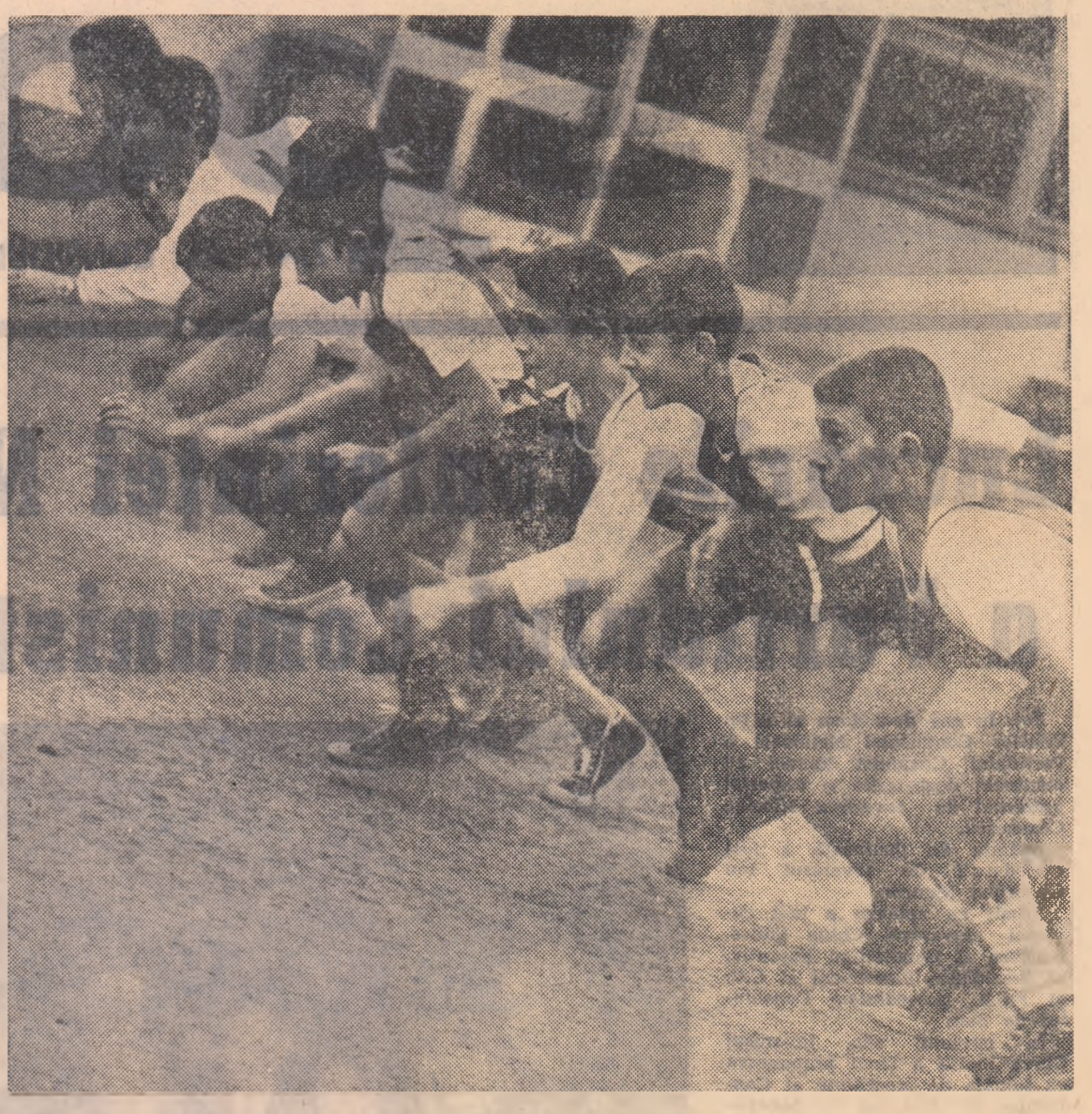
Probleme atletice sînt neapăsate din orele de educație fizică.