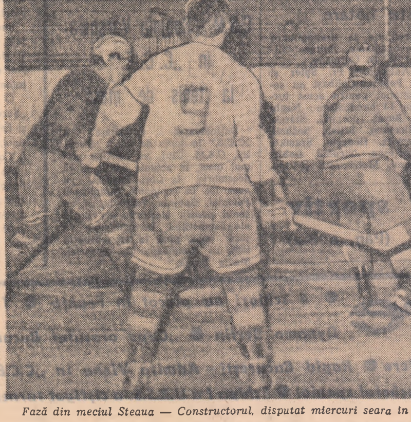
Fază din meciul Steaua — Constructorul, disputat miercuri seara în cadrul campionatului de juniori