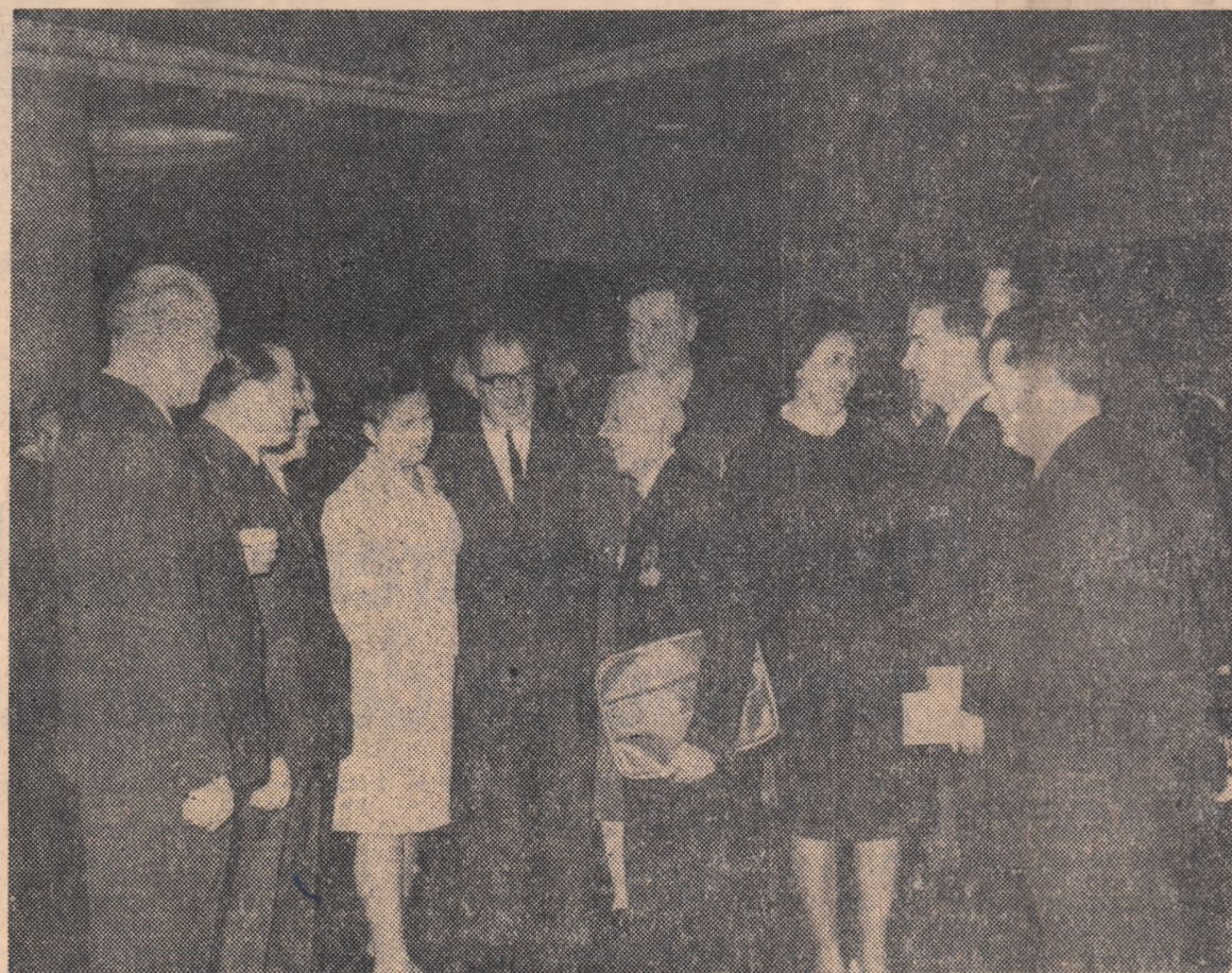
Delegați la Conferință discutând într-una din pauze