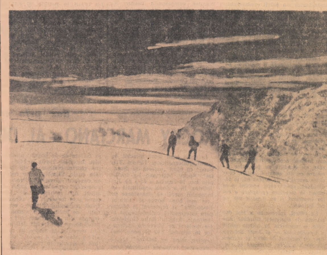
Secretarul de redacție a mai programat o fotografie la acest reportaj. Cum oricît de inventiv ar fi fost, foto-reporterul nu mai putea „regiza” nimic, s-a recurs la fototecă... Imaginea lui O. Cahane este din Caraimanul altor ierni. Ea reprezintă, desigur, o invitație tentantă pentru următorul week-end.