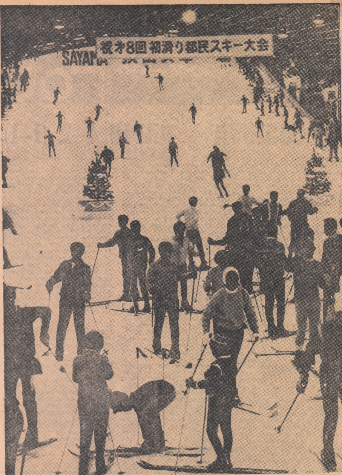
Remarcabil eveniment sportiv la Tokio: recent aici a fost inaugurat un teren acoperit de schi, spre marea bucurie a iubitorilor de sport de toate vîrștele.