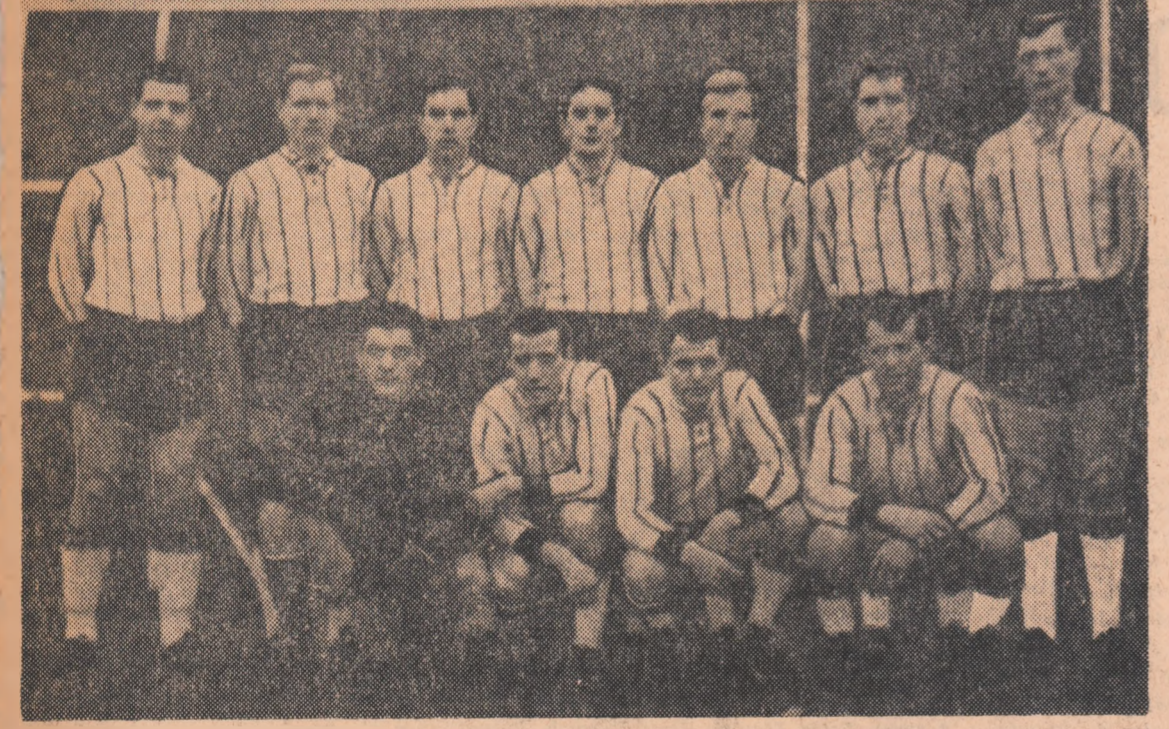
Echipa Alemannia Aachen, pe care urmează să o întîlnească miercuri la Aachen o selecționată divizionară a României.

Joachim NEUSSER redactor la S.I.D. Düsseldorf