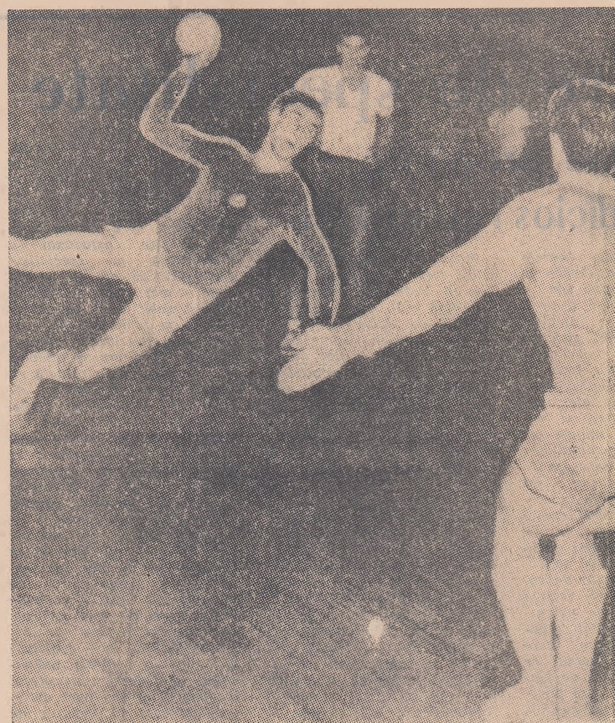
Fază din meciul România — Franța. Guneș transformă o lovitură de la 7 m.

ne anunță că într-un joc de verificare susținut de Mladost în compania echipei Medvesciak (4-2 pentru campioni), cunoscutul internațional Bonacici s-a accidentat, astfel că participarea sa, la primul meci din finală, este incertă.