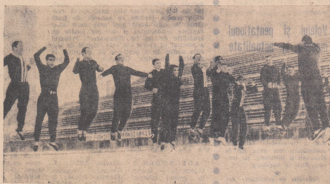
Rapidistii pe zăpadă. Imagine de la primul antrenament în aer liber