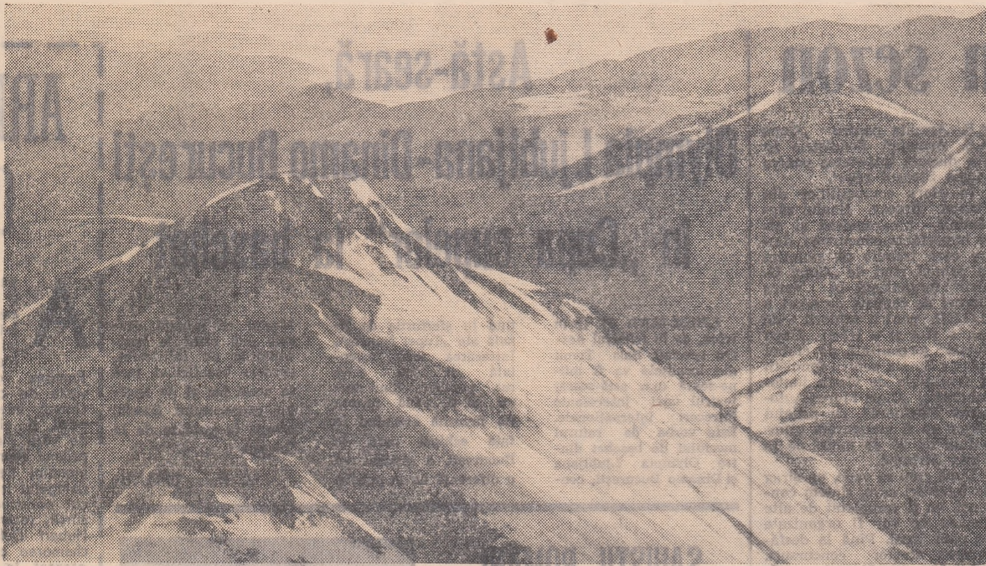
Valea Lăptelui și tîrnița Negoiescului Mare văzute din valea Arieșul Mare

Ajunsem, curînd, la confluența Pîrului Mic (dreapta) cu Izvorul Negoiescului (stînga), de unde continuăm urcșul, în serpentine. La țestrea din pădure, valea se deschide larg