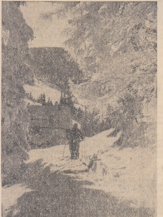
Cabana Diham — pitoresc loc de popas pe Valea Prahovei

În dorința de a contribui la o cit mai judicioasă în-