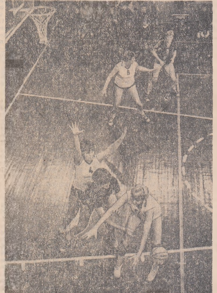
S-a jucat sîmbătă în cel de-al XXXV-lea campionat feminin de baschet al U.R.S.S. Iată o fază din meciul Dinamo (Moscovia) — Kibirkšis (Vilnius), cîștigat de baschetaliștele lituaniene cu 65-49.

fășoază în prezent la Varșovia, selecționata orașului Sofia a învins cu scorul de 71-59 echipa A.Z.S. Varșovia. Într-un alt joc, Legia Varșovia a dispus cu scorul de 96-70 de reprezentativa orașului Helsinki.