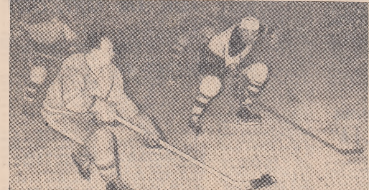
Un atac al echipei sovietice. Apărarea formației C.H.Z. Litvinov face greu față situației, așa cum de altfel s-a întîmplat de neamărate ori în acest joc.

dentă și ciudată lipsă de nerv, jucînd static și fără vlagă. Să fi fost vorba doar de o eclipsă de moment, generată de convingerea că victoria nu le poate scăpa? Să sperăm... Punc-