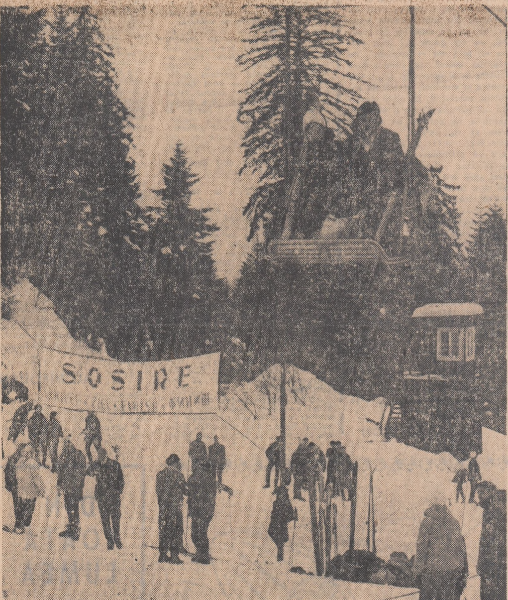
Poiana Brașov în plin sezon de schi