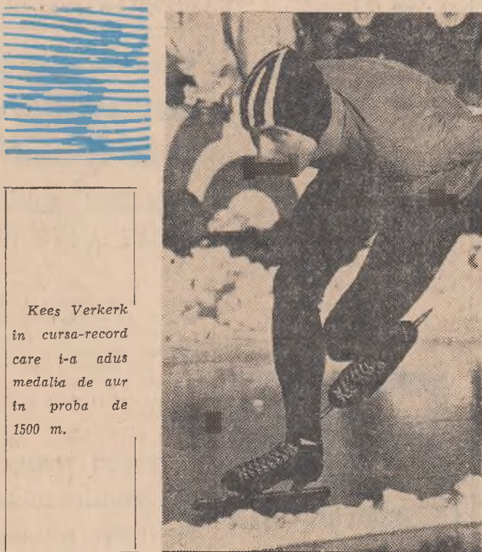
Kees Verkerk în cursa-record care l-a adus medalia de aur în proba de 1500 m.