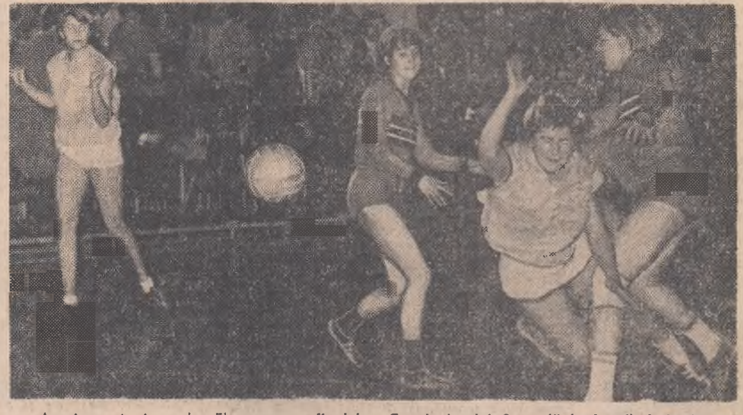
Au început, în sala Floresca, finalele „Cupei ziarului Sportul” la handbal. În fotografie, un atac al brasovencilor la poarta echipei Start Ig. Mureș. Citiți în pag. a 11-a cronica meciurilor din prima zi.