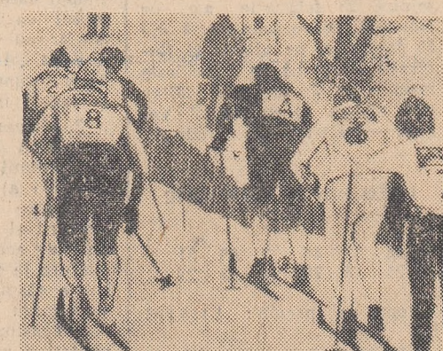
Numai cîteva sute de metri au rămas în urma primelor 8 alergătoare în proba feminină de ștafetă 3x5 km. Plutonul se menține compact.