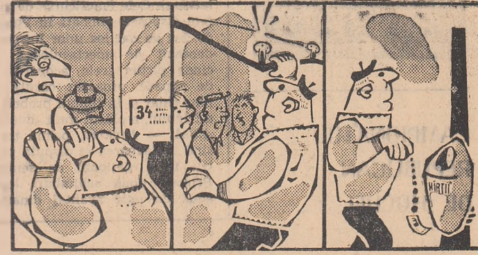
Desen de AL. CLENCIU