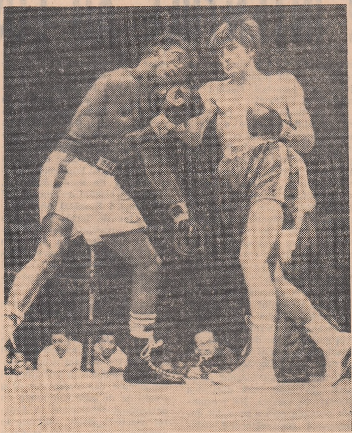
Iată o iază din precedentul meci Griffith-Benvenuti, care a consemnat victoria pugilistului american. Ce se va întâmpla luni?