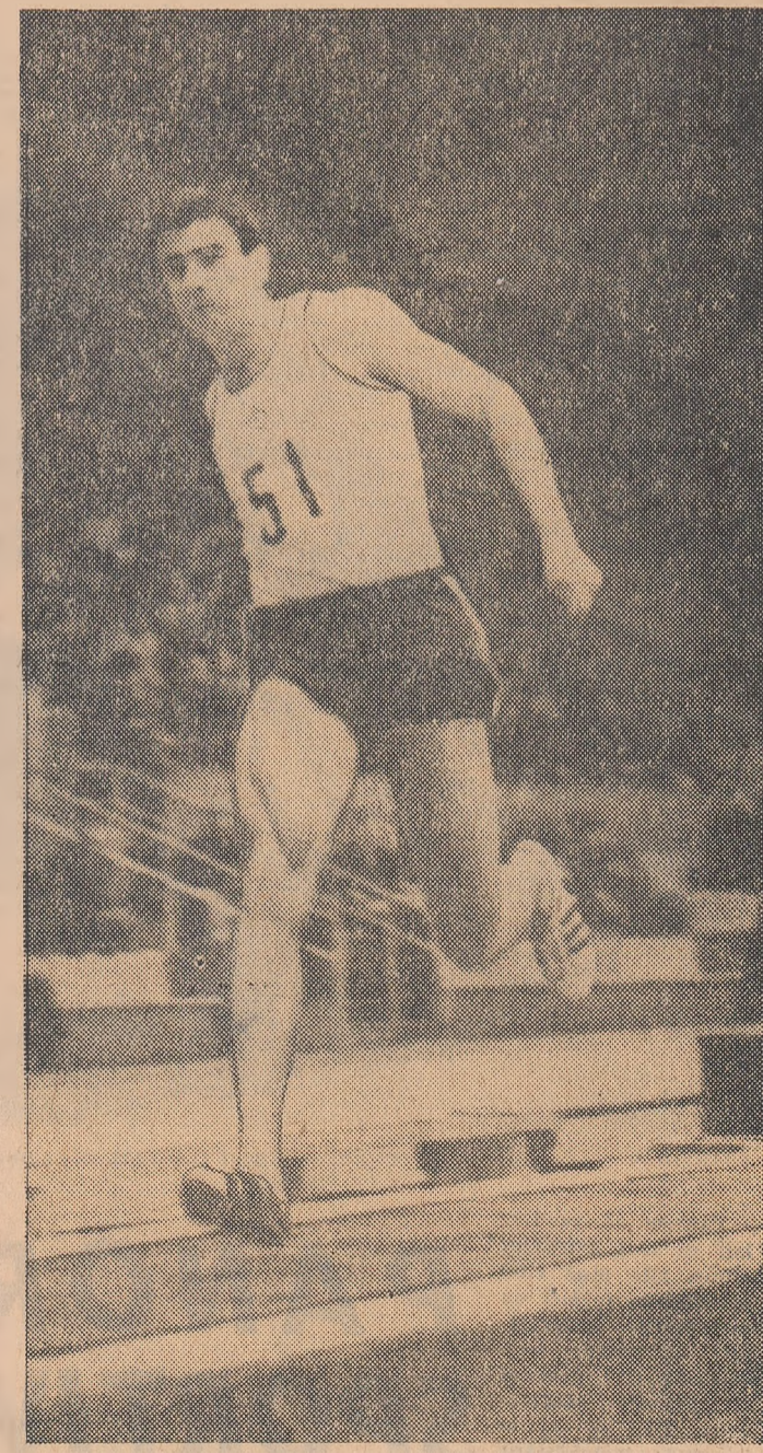
Cu rezultatul înregistrat nu de mult în cadrul întrecerilor atletice pe teren acoperit de la Moscova (15,65 m), atletul sovietic Victor Sameev se înscrie printre cei mai buni săritori de „triplu” din Europa, cu șanse apreciabile și pentru viitoare concursuri în aer liber