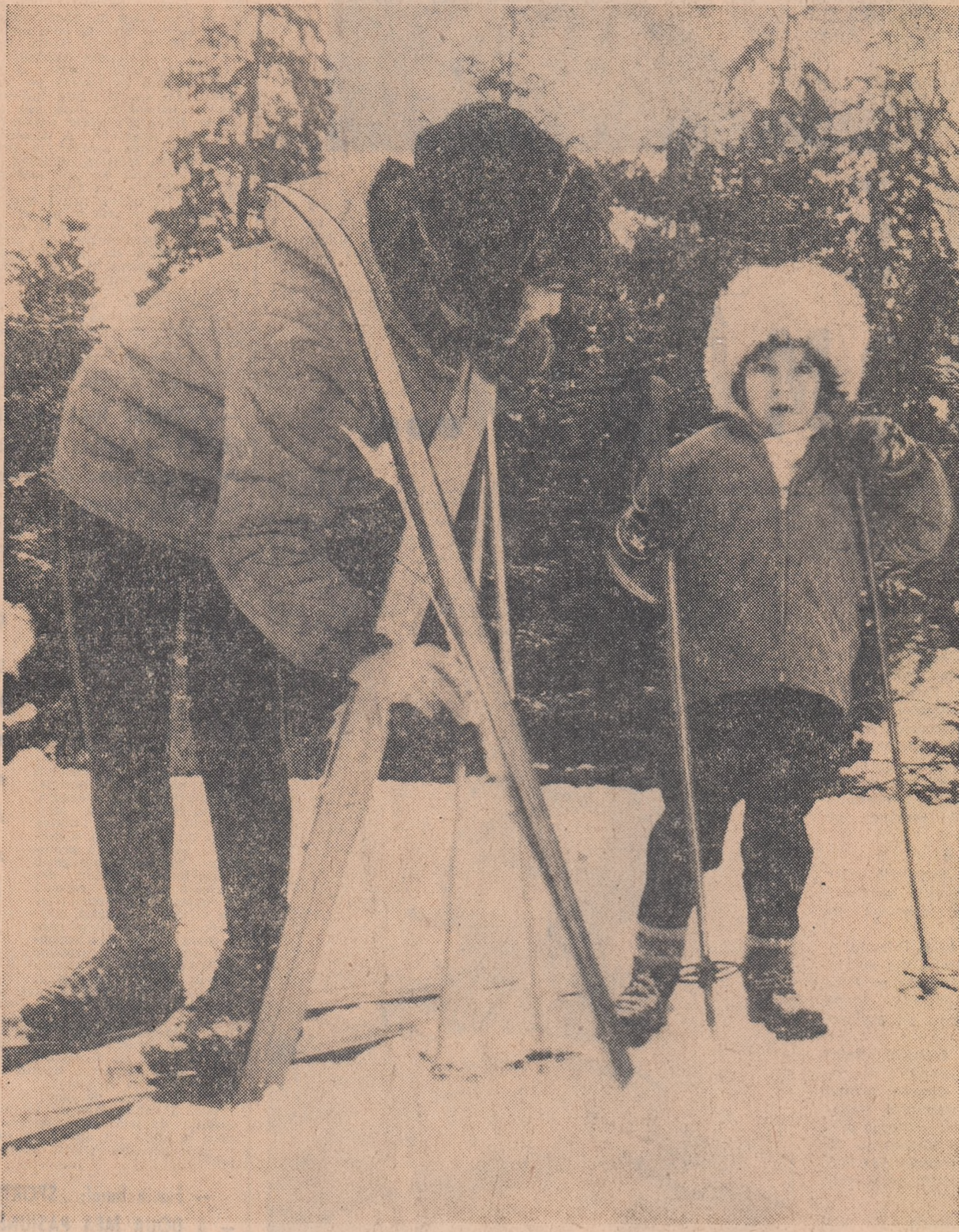
Cu mămica, la schi...