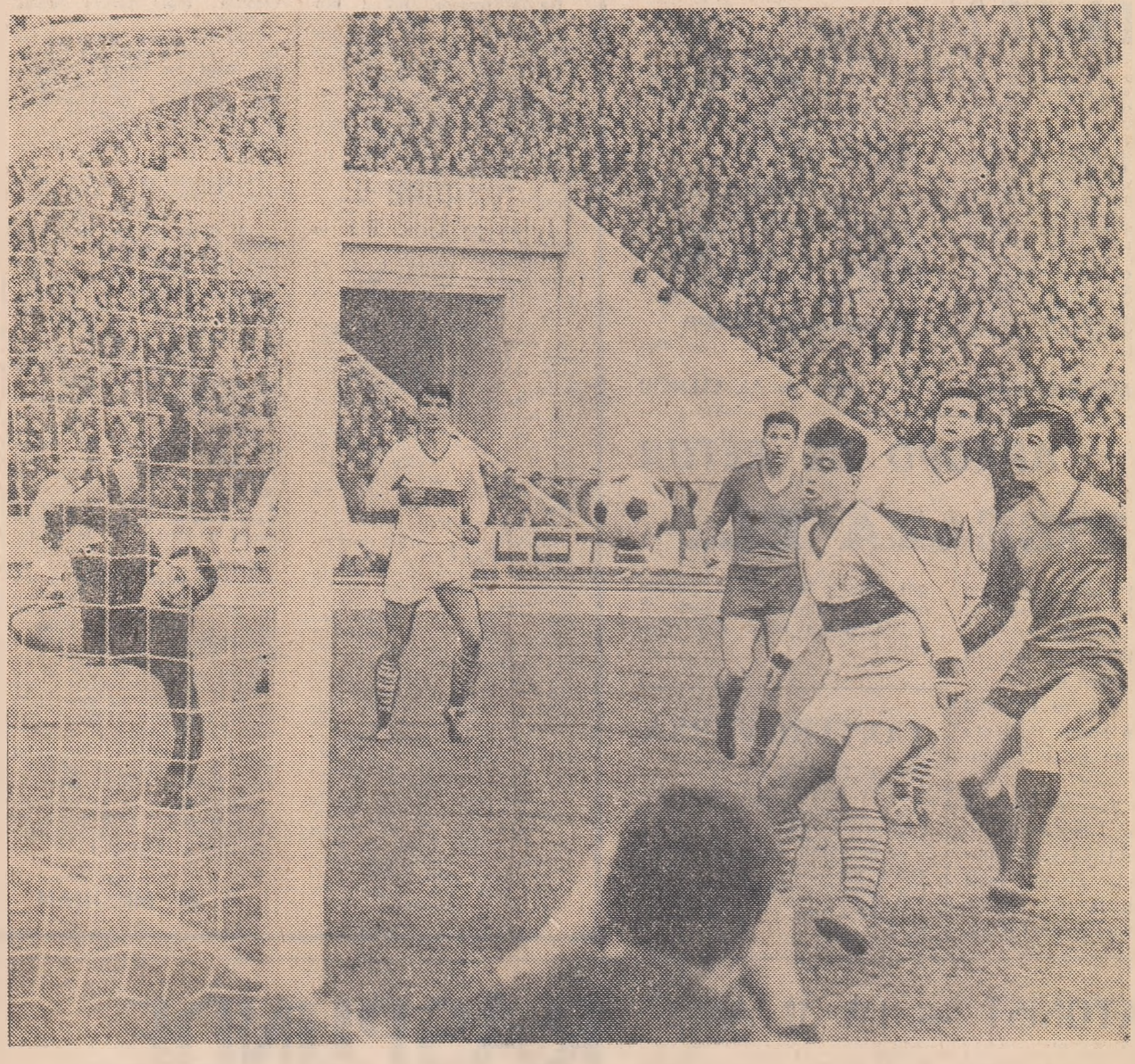
În timpul unei partide Steaua — Progresul; o fază dinamică, de poartă (care oprește respirația „tribunelor”) așa cum am dori să vedem cât mai multe în acest retur al campionatului