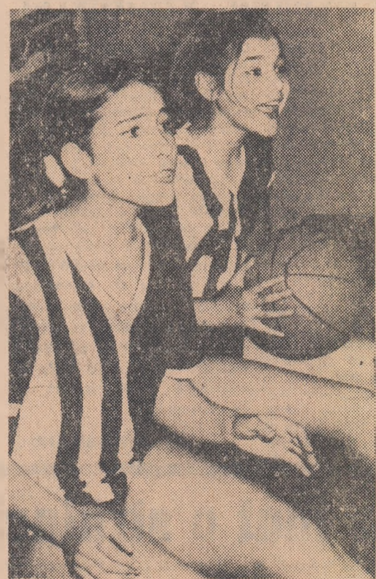
Doouă tinere baschetbaliste și încurajează prin gesturi și vorbe coechipierele de pe teren

★ Finala Steaua — Dukla va fi arbitrată de Hans ROS-MANITH (R.F. a Germaniei).