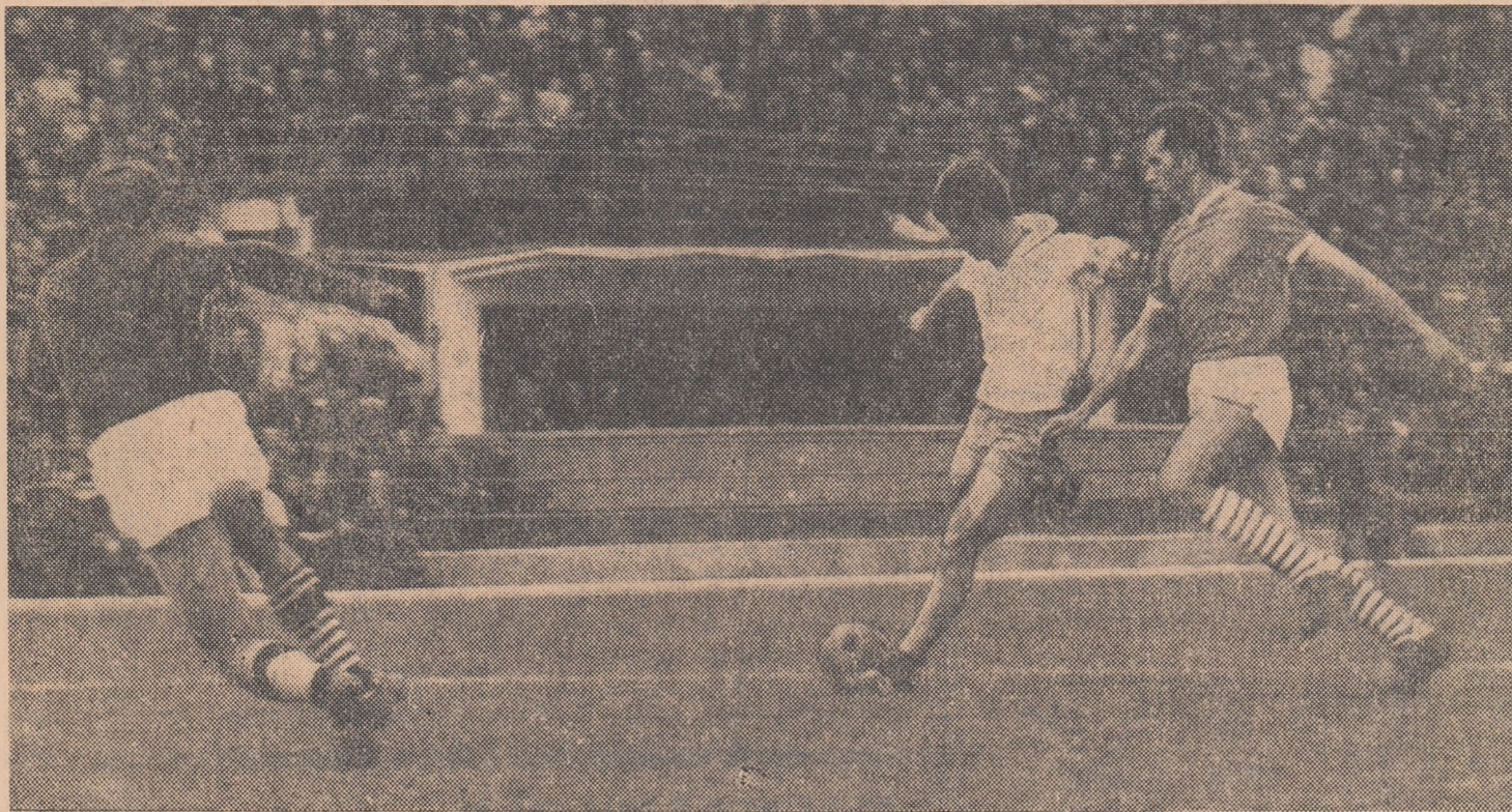
Cuperman, cel mai bun jucător în meciul de la Pitești, l-a depășit pe Ivan și va șuta la poartă