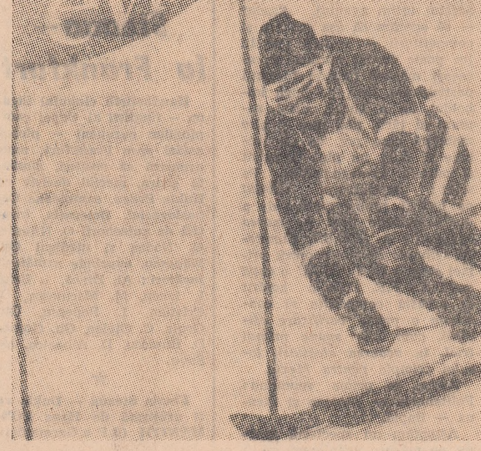
În cursă, Jean-Claude Killy, triplu campion olimpic, câștigător al „Cupei mondiale”, cel mai demn reprezentant al schiului francez