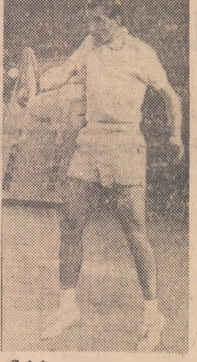
Celebrul rever-piston semnat „Tiri”.

— Ce rezultate se înscriu în palmaresul tenisului românesc după această etapă de competiții peste hotare? — Cu totul, sint 7 victorii — ne reaminteste Țiriac. La Cannes, apoi la Roma — turneul „Parioli” — Catania și Palermo, de