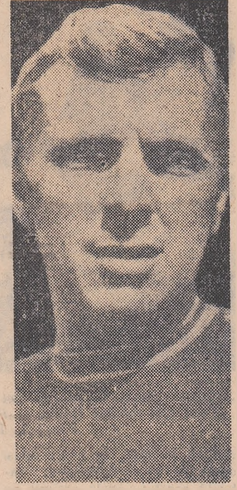
Bobby Moore — căpitanul echipei Angliei

La Ljubljana, în cadrul „Capei balcanice” s-au întîlnit forma-