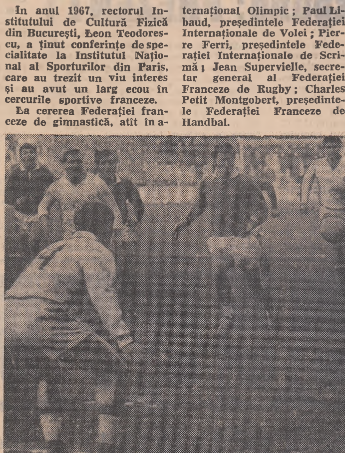
Fază din meciul Franța — România disputat la 10 decembrie 1967 la Nantes

Tenismanul care poartă nr. 1 pe tabloul de simplu al „internaționalelor” de la Roma, este un nume binecunoscut în lumea sportului alb. De origine australiană, născut la Sydney, la 18 octombrie 1940, el este stabilit de cinci ani în Italia, unde a obținut cetățenia. Câștigător al turneelor de la Roma (1965 și 1967) și al celui de la Monte Carlo din 1964, el a fost finalist la Wimbledon, în 1962 (pierde la Laver). A făcut parte din echipa Australiei pentru „Cupa Davis” 1962 alături de Fraser, Laver și Emerson. Un punct maxim în cariera sa l-a constituit sezonul trecut, cînd revista americană de specialitate „World Tennis” l-a clasat al 3-lea în lista mondială a tenisului amator pe anul 1967, după Newcombe și Emerson (1-0), dar înaintea lui Roche (1-0), Santana (1-1), Pilleci (1-1), Bungert (2-0), Graebner, Hewitt (3-0), Taylor (1-1).