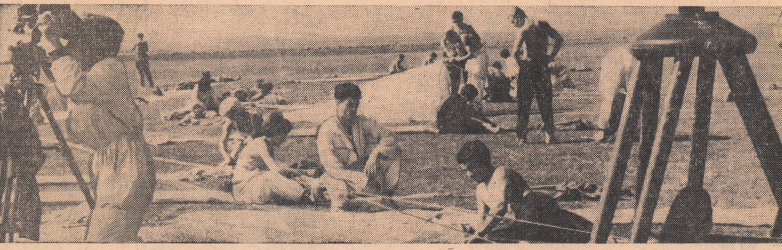
În furul punctului fix...