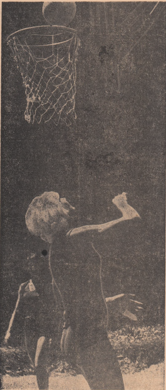
Contrast. O imagine mai mult artistică decât baschetbalistică, surprinsă la un antrenament al naționalei noastre feminine