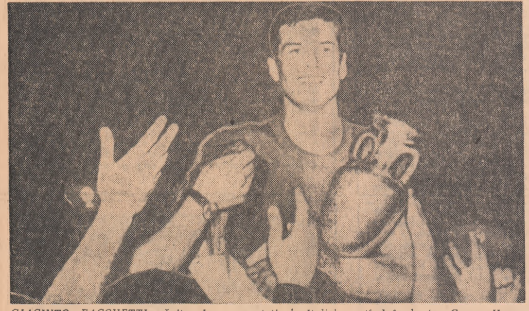
GIACINTO FACCHETTI, căpitanul reprezentativei Italiei, purtînd în brațe Cupa Henry Delaunay