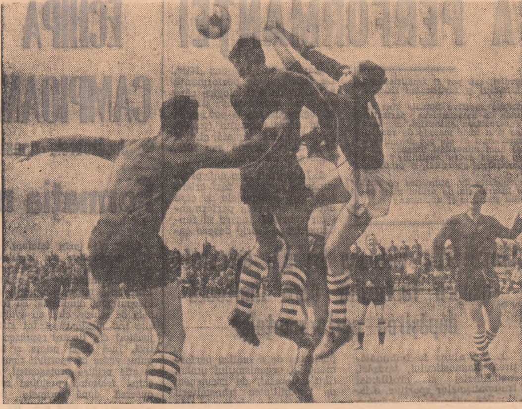
Luptă aeriană pentru balon (Fază din meciul Metalul București — Ceahlăuul Piatra Neamț, divizia B, seria I).