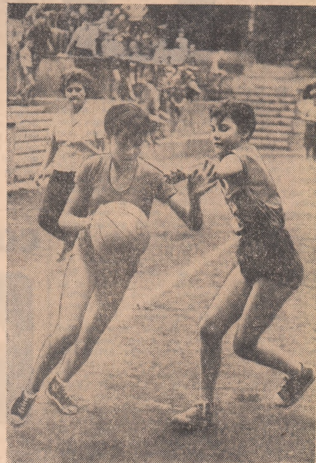
Spre coș...