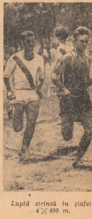
Luptă strînsă în ștafeta 4x400 m.

Despre întrecerile la fotbal, volei și handbal, amănunte în numărul de mîine.