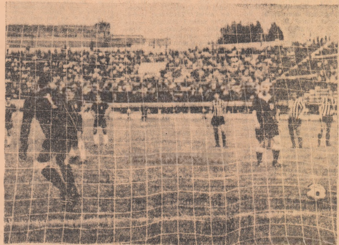
Lupescu a înscris din lovitură de la 11 m, ridicînd scorul în favoarea echipei sale la 3-1. (Fără din meciul tur Rapid — Lokomotiv Sofia)