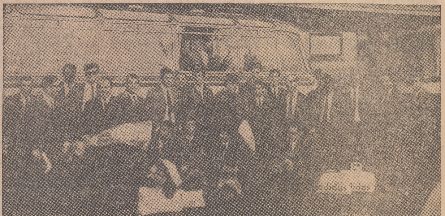
O fotografie „protocolară” la cîteva minute după ieșirea din aeroportul Băneasa.