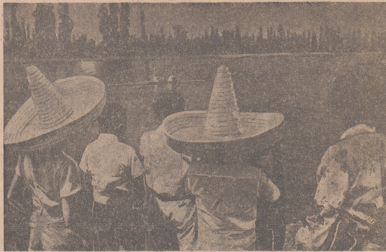
Corespondența specială de la Ciudad de Mexico

„Iar visurile sale sînt adevărurile noastre. Da, sportul este un rang cavaleresc, căci reprezintă o onoare, o etică și o estetică, dar el își recrutează membrii din toate clasele și din rîndul tuturor popoarelor, contopindu-și frățesce pe tot pămîntul. Da, sportul e un răgaz: în societățile noastre tehnologice, supuse asprei legii a muncii, în care nu reprezintă decît ceea ce ai și în care nu ai decît ceea ce câștigi, el e jocul divin care scapă din mâinile lui Dumnezeu și revine la om în epoca noastră...”