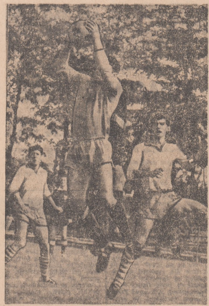
Fază din meciul T.U.G. București — Ș. N. Oltenița.

(Correspondenți: M. Avanu, V. Zbarca, D. Gruia, D. Rădulescu, D. Roșianu, A. Păpăde, D. Diaconescu, C. Filip).