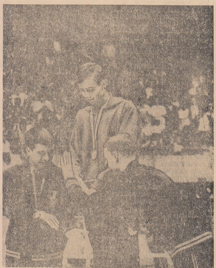
Notătorul din R. D. Germană, Roland Mathes (mijloc) este feliicitat și, la rîndul său, feliicită pe ceilalți medaliați olimpici în proba de 200 m spate. În dreapta, Ivey iar în stînga Horsley

O dată cu întrecerile de spadă pe echipe competiția olimpică de scrimă a luat sfîrșit.