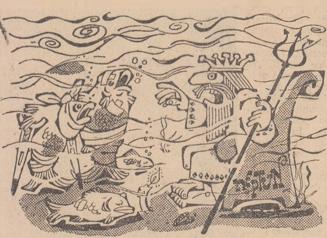
SUB APELE LACULUI XOCHIMILCO