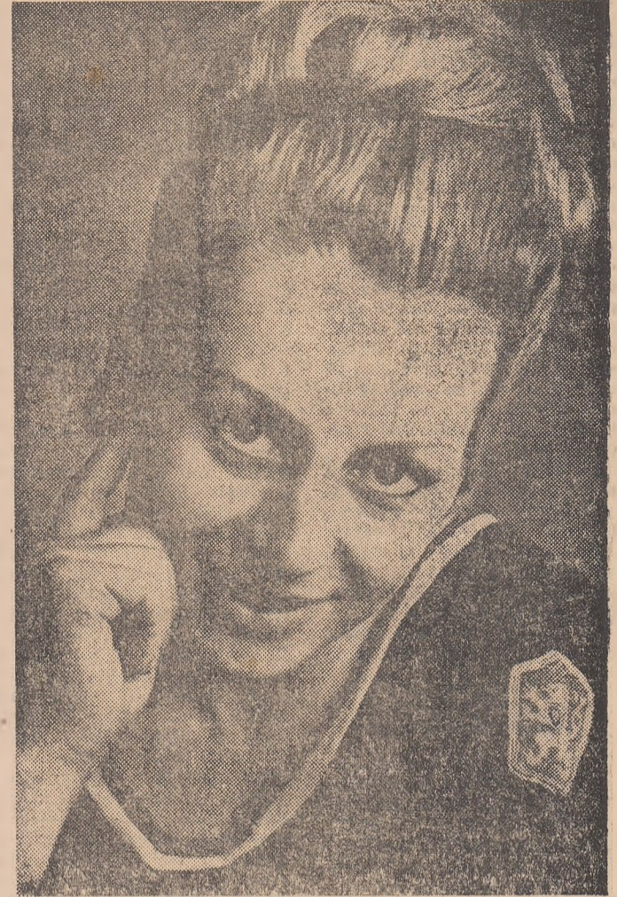
VERA CEASLAVSKA ÎNĂCĂ 3 MEDALII DE AUR PENTRU EXCEPȚIONALA VERA CEASLAVSKA

Concursul primelor șase clase la aparate, programat în după amiaza zilei de vineri, în sala Auditoriului Național, a atras un număr de spectatori, dornici să asiste la „spectacolul de gală” al gimnasticii feminine mondiale. Rînd-a-rînd, întrecerea celor mai bune șase gimnaste la fiecare aparat prilejuiește întotdeauna dispute de o mare spectaculozitate și înaltă măiestrie, ilustrînd în mod convingător tot ce are mai frumos gimnastica. La fel s-au petrecut lucrurile și aici, la cea de a XIX-a Olimpiadă!