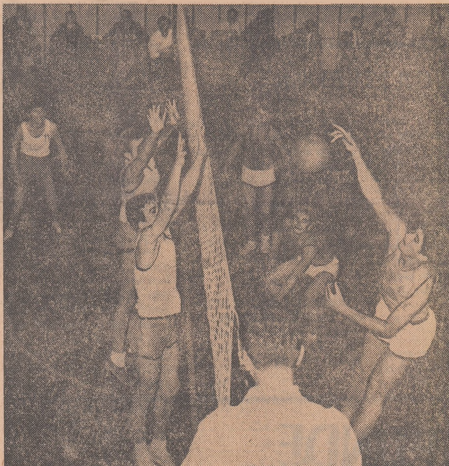
IN CAMPIONATUL DE VOLEI: