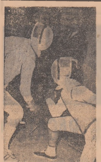
Pe planse — floretisti. Asalt din meciul Bucuresti A — Oradea B.

Simbata a plecat in Cuba Felix Topescu, presedintele colegiului central de antrenori din cadrul Federatiei romane de calarie. Cunoscutul nostru tehnician este invitat pentru o luna de zile, in vederea unui schimb de experienta cu specialistii echipei cubaneze.