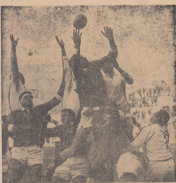
Fază din ultima întâlnire Franța — România, 10 decembrie 1967 la Nantes (în alb jucătorii români)

Iată-ne ajunși în ultimele zile, ceasuri chiar, premergătoare celei de a 16-a confruntări dintre reprezentativele de rugby ale României și Franței. Importanța evenimentului pentru sportul cu balon oval din țara noastră aproape că nu mai are nevoie de argumentare. Este știut că, de mai bine de 10 ani, fiecare asemenea partidă reprezintă momentul adevărului pentru rugbyul românesc. Este știut că nu numai tradiția prietenească, ci și valoarea mondială a purtătorilor ecușonului cu cocoșul galic au făcut ca meciul să constituie, în fiecare an, o sărbătoare, pe care reprezentanții rugbyului românesc se străduiesc să o întindă printre-o cifră mai bună pregătire. Unele ediții au adus mari satisfacții, prin rezultate care au întărit substanțial prestigiul sportului românesc. Le-au adus chiar și după câteva jocuri în care, deși învinși, sportivii noștri au pășit terenul cu fruntea sus, la capătul unei partide în care se arătaseră demni de orice adversari. În care dovediseră că știu să joace rugby. Face, oare, ediția din acest an a meciului România-Franța excepție din vreun punct de vedere? Da, și anume, prin condițiile din ce în ce mai