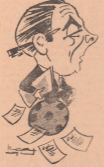
NICOLAE PETRESCU văzut de Neagu RADULESCU

Asta e o situație obiectivă. FOTBALUL NU SE POATE SUSTRAGE VIETII. Ce era Bucureștiul anilor 1930? O trăsură... Un clopot de tram-