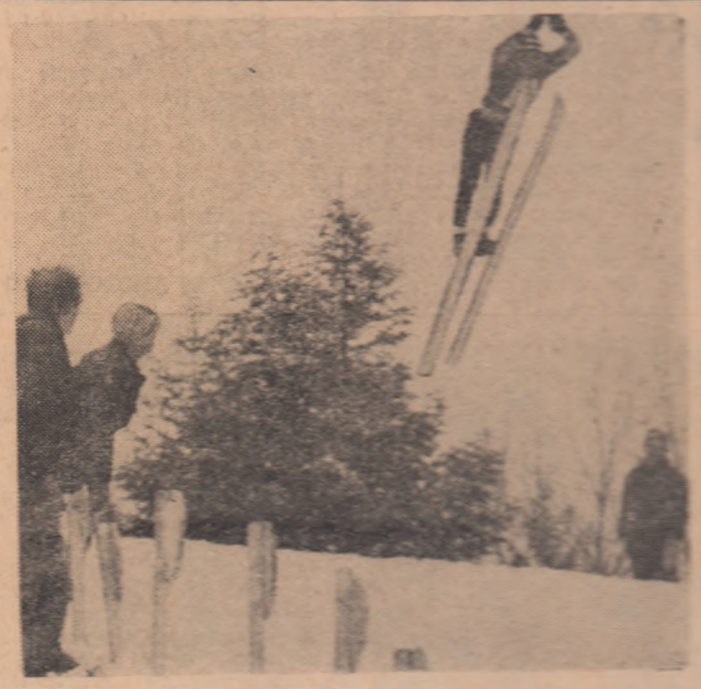
Cițiți în pag. a 4-a

• În seara de 29 decembrie 1968, pe patinoarul artificial al asociației sportive Petrolul, a avut loc deschiderea oficială a sezonului de patinaj în Brașov.