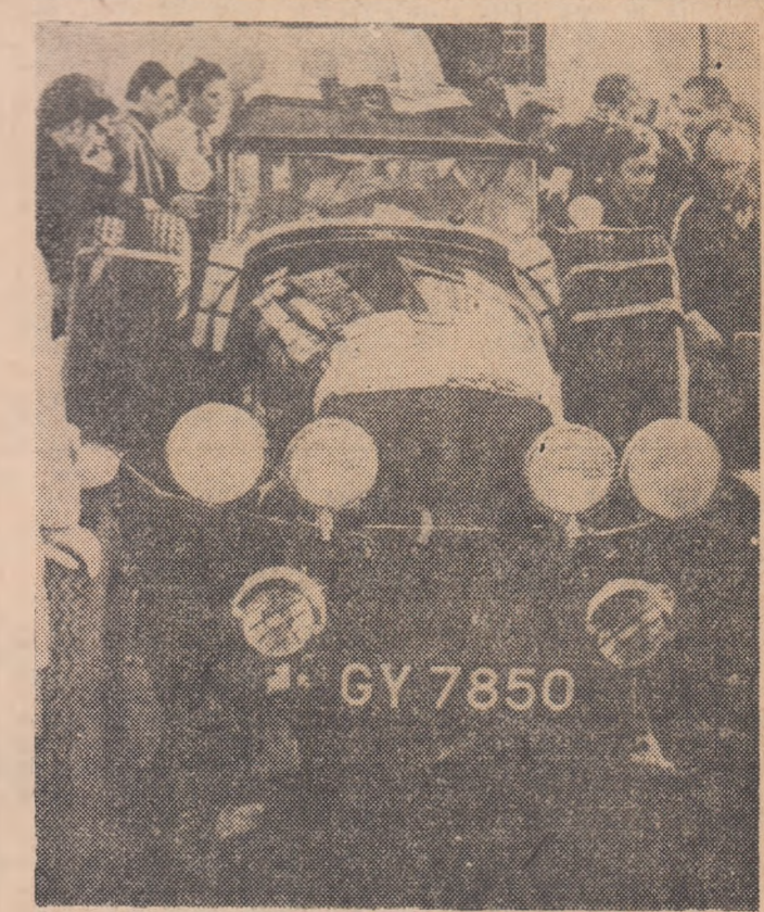
Bentley-ul model 1950, prezent până la jumătatea tronsonului asiatic, a marcat, neprecis, granița dintre tineritate și imprudență

Aproape de Mezand-ran, nefecurii piloți au dat piept cu redutabilul lor inamic de iarnă, poleiul. Și nu numai cu vermurile noastre și-ar fi rescris poate Infernul inspirându-se din cronicile raliului Londra — Sydney, iar etapa Teheran — Kabul ar fi ocupat un loc de cinste. De altfel, expresia „eta-pă dantescă” a figurat în numeroase comentarii ale presei din toată lumea.