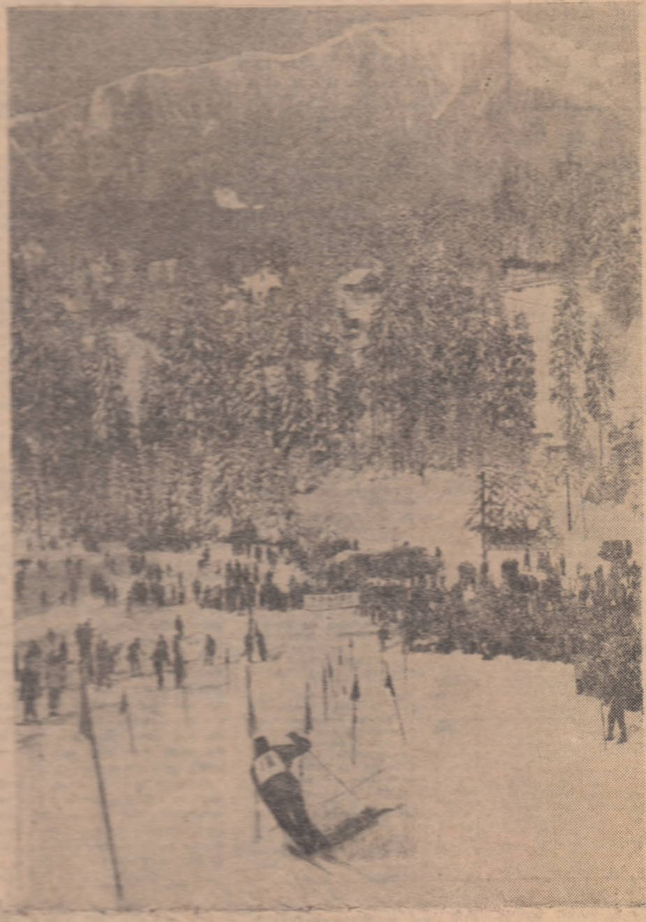
Aspect fetic de pe pîrtia Clăbucet, de la Predeal