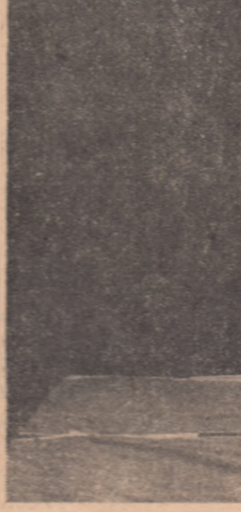
o spectaculoasă kubi-nage (aruncare peste sold cu apucarea gîtului)