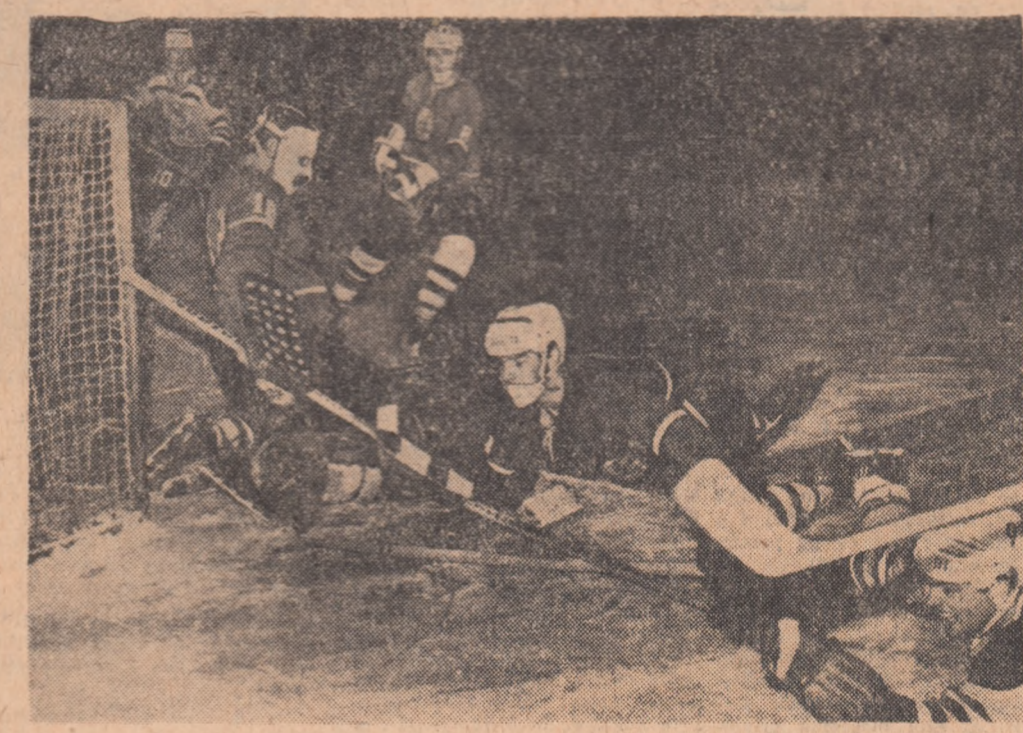
Prea tîrziu! Plonjonul atacantului Neupert de la E.V. Füssen nu va aduce un nou gol echipei sale, care câștigă totuși derbyul campionatului vest-german de hochei pe gheață, întrecînd cu 2-0 pe E.C. Bad Tölz.