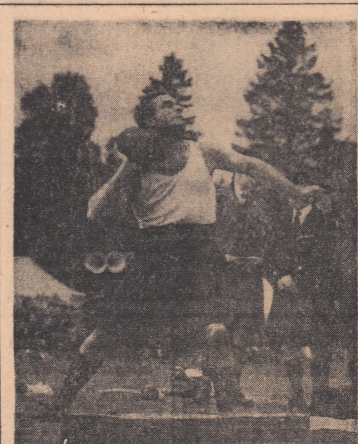
Variante scoțiană a arun cărîi greuțîi. Bila cîntărește aproape dublu decît cea regulamentară de 1,357 kg.