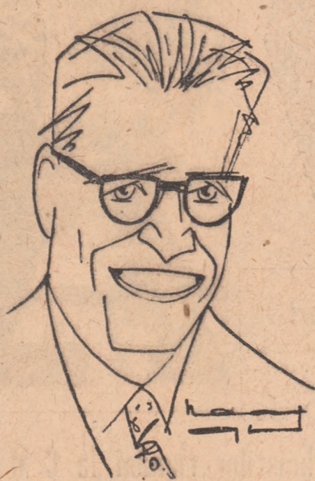
Acad. GHERASIM CONSTANTINESCU văzut de Neagu RADULESCU

„Pe o bicicletă aproape ruginită, cumpărată pe bani pușini de la un negustor de fiare vechi, am folosit împrejurarea că studiam la Montpellier și am pornit, în prima vacanță, în jurul Franței. Dar nu într-un „pachet” competitiv cu marii cicliști, și nici ca în acel film ce rula în serii, acum vreo patruzeci de ani, intitulat „regele pedalei”, în care, între scenențele desfășurării reale ale Turului Franței, a fost intercalat de către cineștii vremii, acel excelent și popular comic, Biscot, că, așa, pornit pe soselele Franței, de unul singur pe bicicletă, pentru a mă mișca, pentru a-mi verifica voința și alifetă dect în lumea studiilor mele agro-viticole — ne spune academicianul Gherasim Constantinescu, figură proeminentă a științelor agro-technice de la noi.