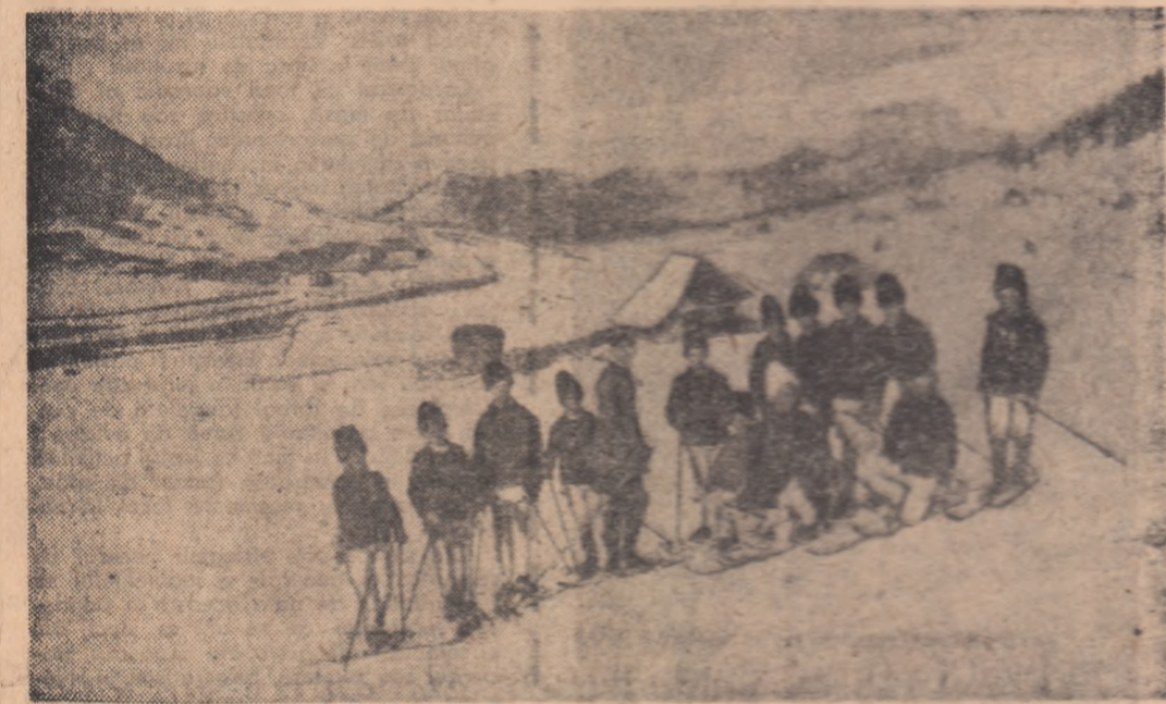
Copii ai centrului de inițiere organizat la Fundata în anul 1929-1930

zeren de pe Roia de sus, care s-a bucurat de un mare succes.