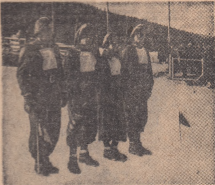
Concurînd la Zakopane, în 1939

celeri din clasele V-VII, s-a organizat, în luna martie 1930, primul concurs public de schi cu premiul, pentru probele de coborîre din vîrfurile Podul Crucii și de fond pe variatul