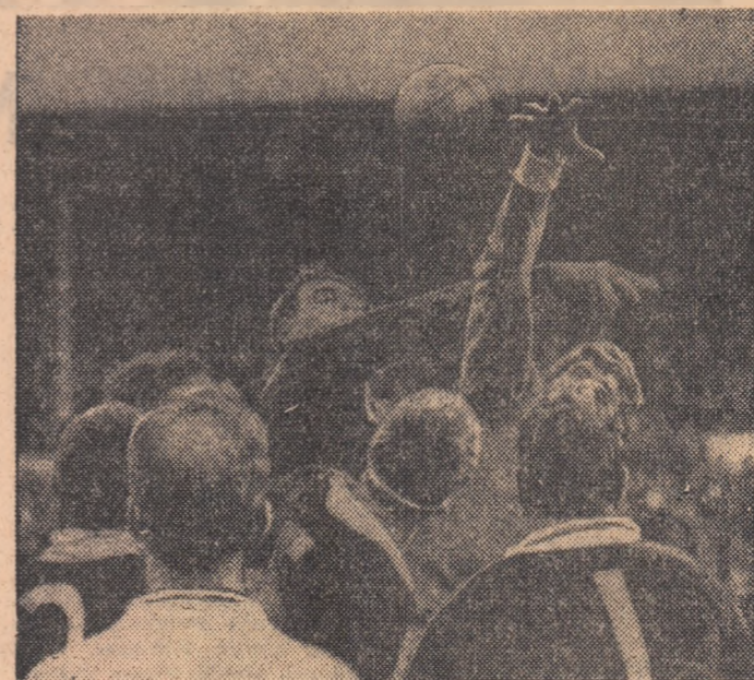
Un duel de uriași ai „ovalului” opunând pe Brian Lochore (căpitanul echipei Noii Zeelande) și Walter Spanghero (Franța). Va putea fi revăzută această spectaculoasă fază de rugby într-o viitoare „Cupă Mondială”?