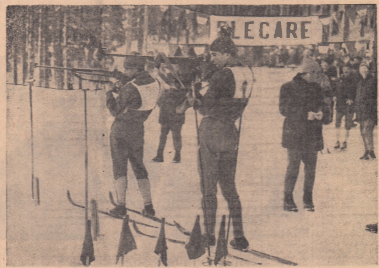
După efortul alergării pe schiuri, tragerea din poziția în picioare solicită o mare relaxare fizică și concentrare psihică. Fiecare cartuş ratat înseamnă minute în plus la timpul general.

Deocamdată biatloniștii se acomodează cu nolle condiții de concurs. Primii soseți în Polană au fost tinerii reprezentanți ai Suediei, considerați printre favoriții întrecerii, care au des-