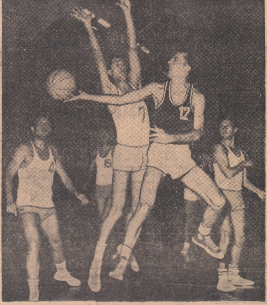
Campionatul de baschet din nou în actualitate. Începînd de duminică vînzîm 4 din nou — martorii pasionanți întreceri republicane, cu țara sponsorizîndu-se semnificativ cele de mai sus (meciul Rapid — I.C.H.F. din ieri).

Și, iată-ne după 24 de ore pe același stadion. Toată ziua soarele strălucise puternic dar parcă a fost un făcut: exact în momentul deschiderii noului joc ploaia era prezentă la rendez-vous. Arbitrii s-au încăpățînat și au fluierat începutul meciului, dar după trei minute nu au știut cum să fugă mai repede la vestiare. În această situație, organizatorii au hotărît mutarea teatrului de desfășurare într-o sală aflată la 20 km de Tel Aviv. Aici însă avea să ne aștepte o altă surpriză. În momentul cînd am ajuns la fața locului, sala fusese luată