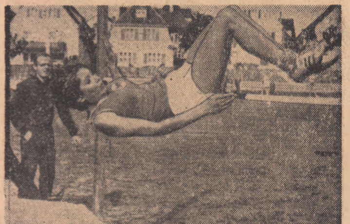
Pină și fetele exersează stilul Fosbury. O tânără atletă vest-germană sare cu succes — în acest stil — 1,46 m. În fotografie se poate observa salteaua de bucurie.