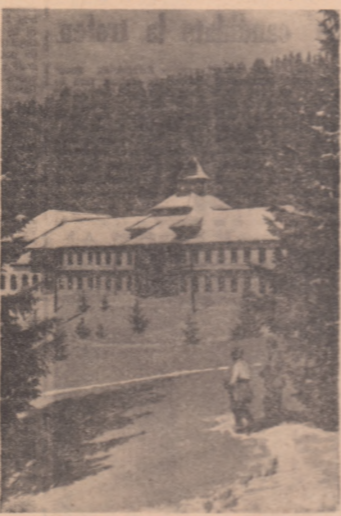
Stiauna „Stina de Vale” este mult cunoscută de cei dorind de a-și petrece timpul liber în oraul curat de munte. În foto: o parte din cabana acestei stațiuni.

Această soartă este hără-zită peșterii de la Me-ziad. Peșteri sint pe lume multe, în județul Bi-