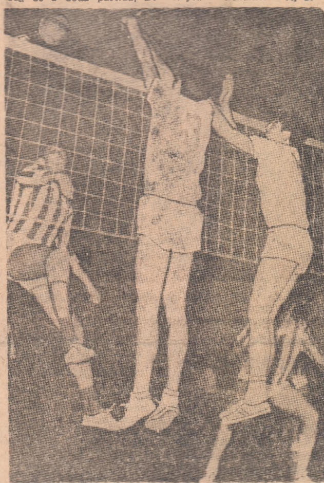
Blocajul jucătorilor de la Dinamo a fost... pe față.

namo — Zelesniclar, bucureștenii au cîștigat fără eforturi două seturi dar, jucînd foarte atent în apărare și eficient în atac, oaspeții și l-au adjudecat pe cel de al treilea. Pînă la urmă, însă, dinamoviștii s-au impus, obținînd victoria cu 3-1 (10, 5, —, 6). Sîmbătă, de la ora 16, sînt programate — în aceeași sală — meciurile Progresul — Zelesniclar și Rapid — Dinamo. A. B.