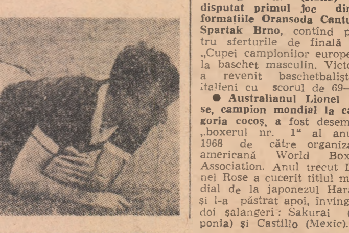
● Australianul Lionel Rose, campion mondial la categoria coș, a fost desemnat „boxerul nr. 1“ al anului 1968 de către organizația americană World Boxing Association. Anul trecut Lionel Rose a cucerit titlul mondial de la japonezul Harada și l-a păstrat apoi, învingând doi șalangeri: Sakurai (Japonia) și Castillo (Mexic).

anul Xavier Kurmann: 5 km în 6:08,40 și 10 km în 12:26,20. ● Criteriul european cu antrenament mecanic disputat pe velodromul acoperit din Anvers, a revenit ciclistului olandez Peter Post, care a acoperit în 60 de minute 61,375 km.