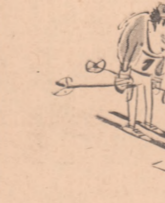
Desen de MATTY