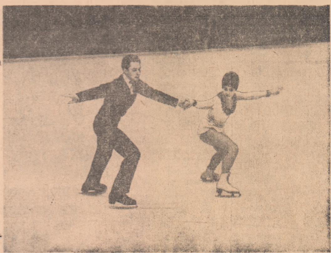
Ca și la Garmisch, perechea patinatorilor sovietici Irina Rodnina și Alexei Ulanov a urcat pe prima treaptă a podiumului.

● CUPLUL RODNINA — ULANOV DIN NOU ÎN FRUNTE ● BELOUSOVA — PROTOPOPOV RETROGRADAȚI LA LOCUL 3 ● CAMPIOANA FIGURILOR IMPUSE ESTE BEATRIX SCHUBA