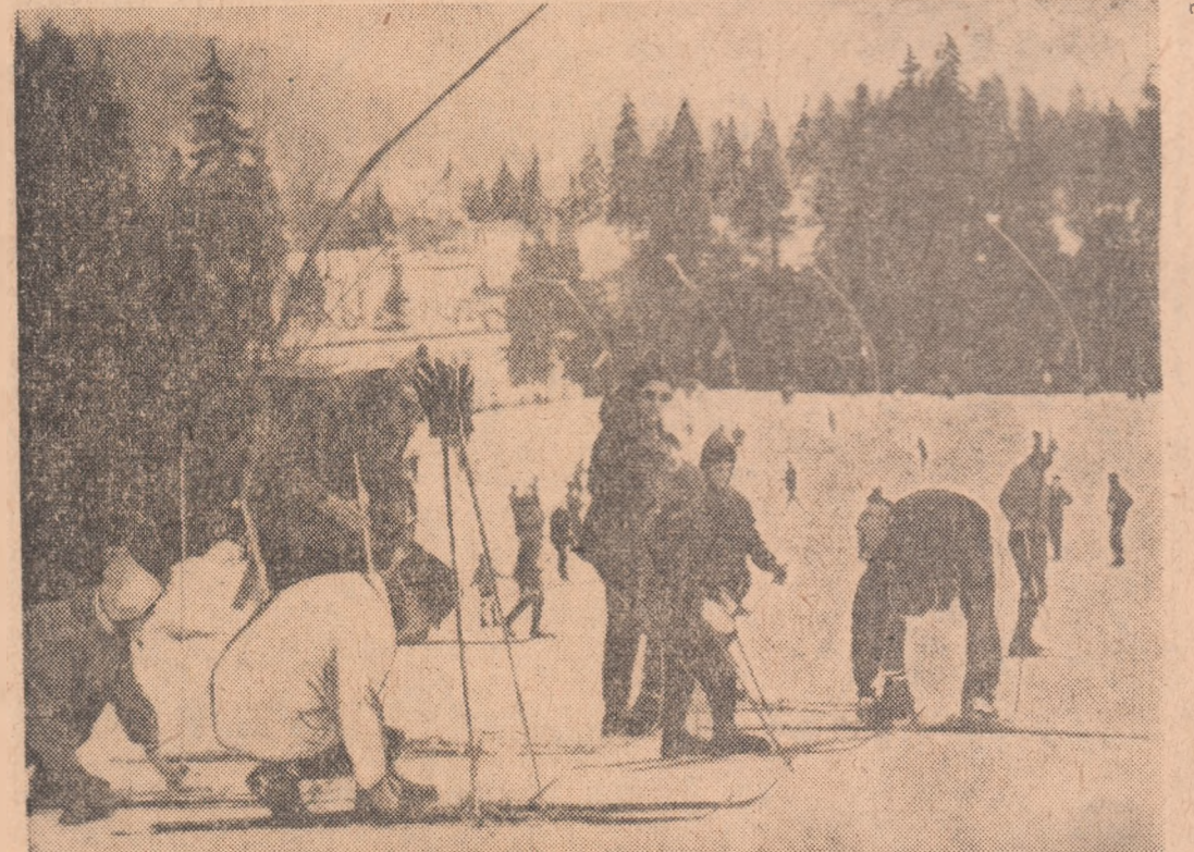
Iarna aceasta nesfîrșită, nesuferită pentru unii, a constituit un deliciu pentru iubitorii sporturilor de iarnă. O dovedește și această imagine, surprinsă la Predeal, pe pista de pe Clăbucet.