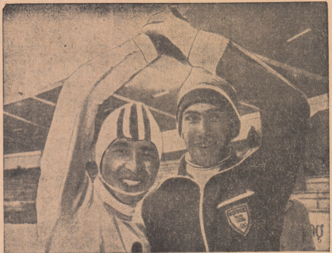
Doi dintre performerii concursului internațional de patinaj viteză de la Inzell, încheiat ieri: japonezul Keichi Suzuki (record mondial egalat pe 500 m — 39,2) și norvegianul Ivar Erikson (record mondial pe 1000 m — 1:19,5). În același concurs, Kees Verkerk a coborît la 7:13,2 recordul lumii pe 5000 m