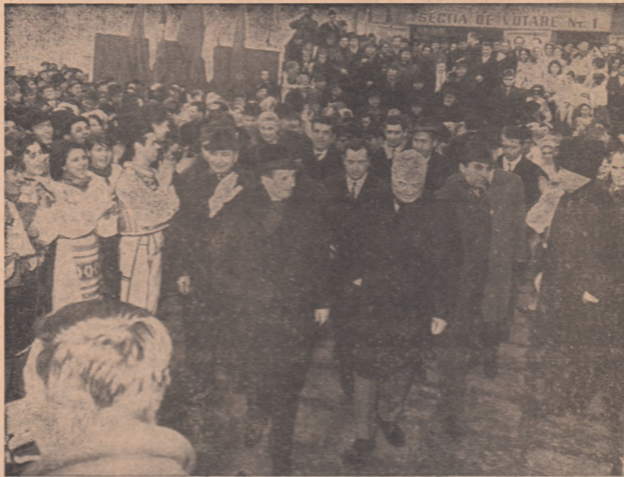
Conducătorii de partid și de stat în mijlocul alegătorilor din circumscripția electorală 23 August București

La ieșirea din secția de votare, alegătorii și, alături de ei, sute de oameni ai muncii din cartier, înconjoară din nou, cu deosebită căldură, pe aceia cărora le-au încredințat destinele patriei noastre, ovaționînd pentru Partidul Comunist Român și Republica Socialistă România, scandînd numele secretarului general al C.C. al partidului, tovarășul Nicolae Ceaușescu. Zeci de brațe aruncă flori în calea conducătorilor iubiti, în timp ce bucuria și emoția strălucesc în ochii tuturor. Asistăm la o minunată expresie