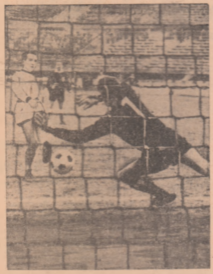
Prima etapă a returului campionatului italian a avut loc duminică la ora 18.00 pe stadionul Hoff înscrisul al doilea gol pentru Wiener Sportklub

Din nou șase scoruri egale în campionatul italian și numai 10 goluri în total. Derby-ul etapei, Internazionale — Milan, a avut loc pe „San Siro”, în fața a 90 000 de spectatori. Inter a deschis scorul în min. 52 prin Corso, iar cu 5 minute înainte de final Milan a egalat prin Prati. Astfel, meciul s-a încheiat la egalitate: 1-1. Lanerossi nu a putut învinge pe Cagliari (scor 1-1). Lanerossi a marcat primul gol prin Rei, iar Riva a înscris punctul egalizator. Astfel, Cagliari se menține în fruntea clasamentului cu un punct avans față de Milan și Fiorentina. Celelalte rezultate ale etapei și autorii golurilor: Atalanta — Pisa 1-1 (Clerici, respectiv Cosma), Juventus — Varese 2-0 (Benetti și Anastasi), Sampdoria — Roma 0-0, Verona — Palermo 2-0 (Bui 2), Bologna — Fiorentina 0-0, Napoli — Torino 0-0. Clasamentul: 1. Lanerossi 20 11 8 1 31-11 30 2. Milan 20 10 9 1 21- 7 29 3. Fiorentina 20 10 9 1 20-12 29 Cesare TRENTINI