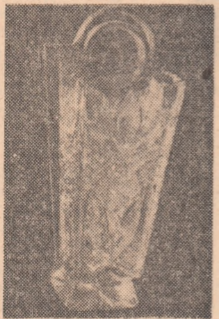
Locul II pe națiuni