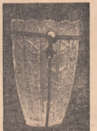
Locul III pe națiuni