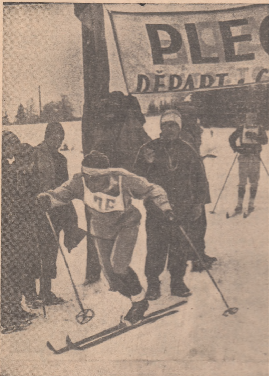
Start spre titlul de campion balcanic

decor între feerie și descrierile din romanele lui Dickens, pe patinoarul din Poiana Brașov a avut loc ceremonia oficială, solemnă, de deschidere a celei de a doua ediții a Campionatului balcanic de schi. Programul acestei competiții prevede ca mîine (n.r. astăzi), schiorii din Bulgaria, Grecia, Iugoslavia, România și Turcia să-și dispute următoarele probe: ora 8,30: fond 15 km seniori, ora 8,45: fond 10 km juniori, ora 11: slalom uriaș pentru seniori și juniori. Duminică vor avea loc stafetele 3 x 10 km seniori, 3 x 5 km juniori și cursele de slalom special pentru seniori și juniori. În încheiere, reamintim pe ocupanții primelor locuri la ediția inaugurală a Campionatului balcanic desfășurat