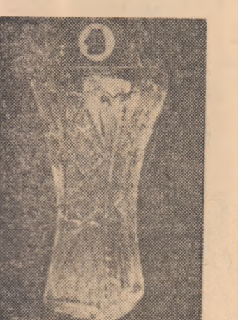
Celul mai tînr campion