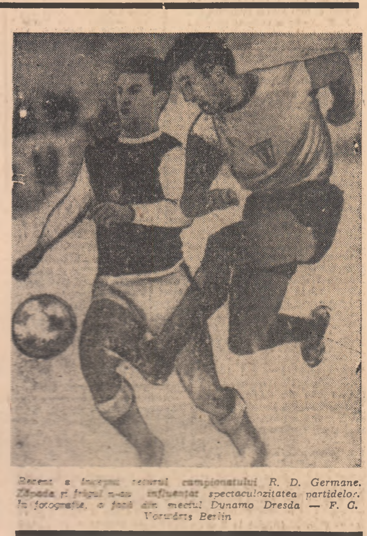
București a învins scorul campionatului R. D. Germane. Zăpada și frigul n-au influențat spectaculozitatea partidelor. În fotografie, o fază din meciul Dynamo Dresden — F. G. Vorwärts Berlin.

ITALIA: Cagliari învinsă pe teren propriu! Cea mai mare surpriză a actualului campionat a furnizat-o Juventus, învingătoare ieri cu 1-0, la Cagliari! Astfel, echipa din Sardinia pierde al doilea meci din campionat și totodată, cedează primul loc Fiorentina, care a câștigat cu 3-0 partida cu Lanerossi. Performanța Juventusului este demnă de toată aprecierea echipei din Torino a jucat excelent și a meritat victoria grație golului marcat de Anastasi în min. 52. Milan a scăpat ocazia de a trece pe primul loc, dovedit din nou că trece printr-o acută criză de formă: Milan — Atalanta 0-0 (și zecezeci meci egal ai milanezilor: în actualul campionat). O partidă de mare interes a avut loc la Roma între actualii și fosta formație antrenată de Heleno Herrera. Numai că H.H. a primit o grea lăvitură: Roma — Internazionale 4-3. Fiorentina a desființat scorul, câștigând la majoranță și al treilea gol a fost marcat la o lovitură de sancționare. Alte rezultate: Napoli — Bologna 1-1; Torino — Palermo 3-1; Varese — Sampdoria 0-0; Pisa — Verona 1-1. Poziția echipelor fruntase: