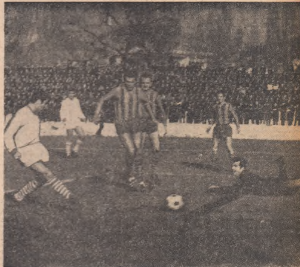
Frățilă îndeplinește o simplă formalitate împingând balonul în poartă. Așa s-a înscris primul gol.

Să totuși, dacă ar fi să acordăm micul „cerb de aur“ al echipei, el ar reveni, fără îndoială, CRISULUI, care, în numai 90 de minute, a regăsit respirația primei divizion. De acord?