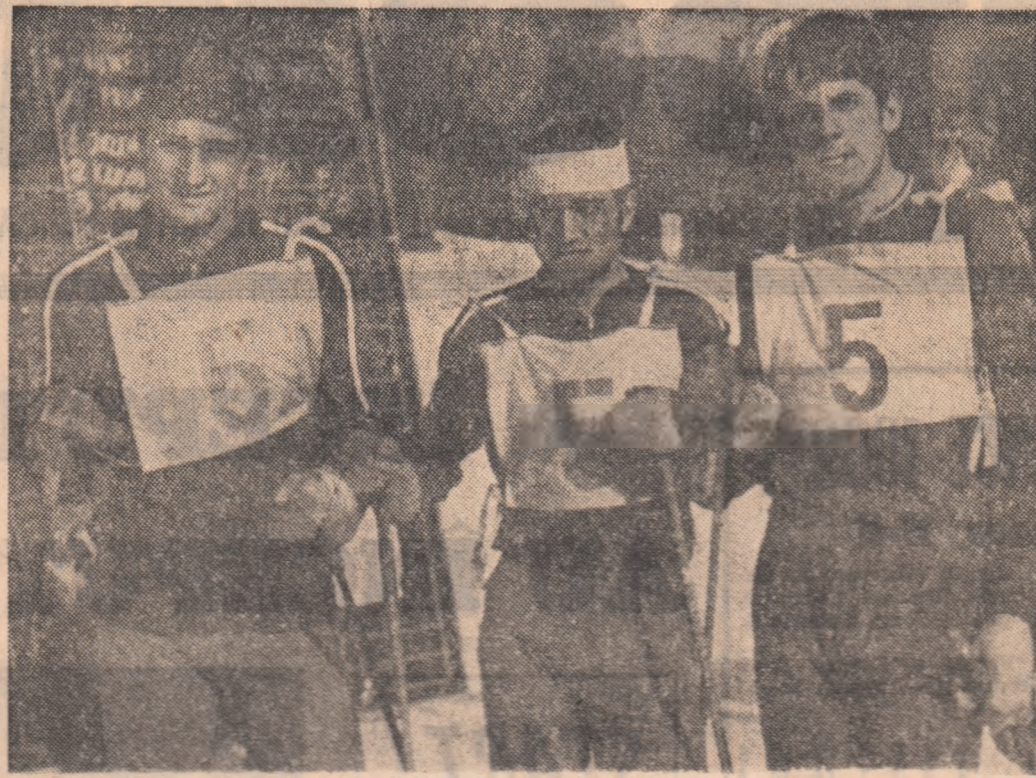
Echipa României de juniori, câștigătoare balcanică la proba de stafetă schi-fond.

PENEV (Bulgaria) 71,74 (37,01 + 34,73); 2. Al. Bogdan (România) 72,43 (36,18 + 36,25); 3. D. Jaunik (Iugoslavia) 73,22 (37,33 + 35,89); 4. N. Jakapov (Bulgaria) 73,78; 5. C. Stras (Iugoslavia) 74,25; 6. T. Benic (Iugoslavia) 74,40; 7. I. Karamitchev (Bulgaria) 75,88; 8. N. Ghimbăsan (România) 76,39; 9. A. Kibil (Turcia) 79,36; 10. Z. Hambic (România) 80,44.