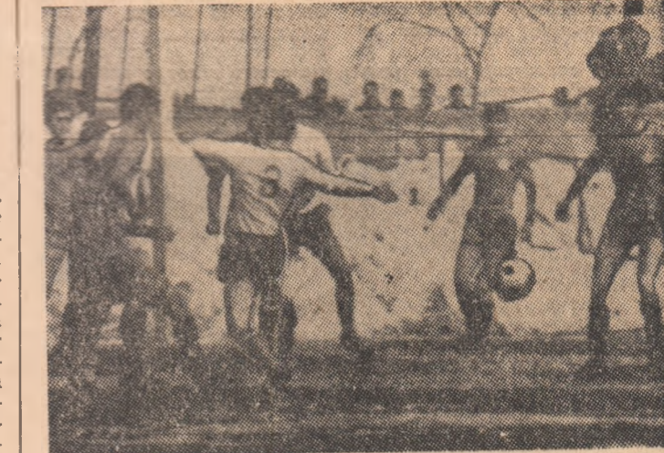
Fază din meciul de divizia B, Electronica Obor București — Gloria Birlad. Moment de tensiune la poarta birădenilor.

Efana vîitoare: Oțelul Galați — Steagul roșu Brașov, Portul Constanța — C.F.R. Păscani, Progresul Brăila — Ceahlăul P. Neamț, Metrom Brașov — Electronica Obor, Metalul București — Flacăra Moreni, Gloria Birlad — Poiana Cimpina, Politehnica București — Politehnica Galați, Dunărea Giurgiu — Chimia Suceava.