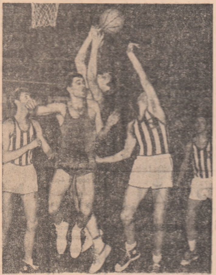
Dispută pentru mingea în meciul de baschet dintre echipele Steaua și Politehnica Galați.

NIVERSITATEA CLUJ (m) 64—96 (28—47); DIVIZIA B (masculin): Universitatea Iași—I.E.F.S. II 72—61 (33—32); Politehnica Cluj—Crisul Oradea 62—64 (38—29); Steagul roșu Brașov — A.S.A. Bacău 72—59 (33—24); Comerțul Tg. Mureș—Medicina Timișoara 83—38 (43—21); Progresul București — Constructorul Iași 54—48 (34—21); Constructorul Arad—Școala sportivă Medias 72—46 (36—19); Olimpia Satu Mare—Știința Petroșeni 49—47.