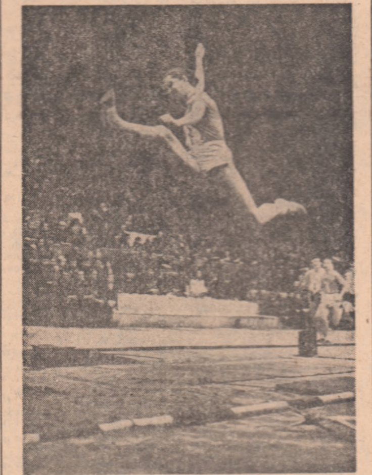
Una din performanțele recentului concurs internațional atletice pe teren acoperit, desfășurat la Palatul Sporturilor din Moscova, prezintă un stil impresionant la slăbitura în lungime. Este atleta sovietică Nina Krotter, care a reușit o săritură de 6,38 m.