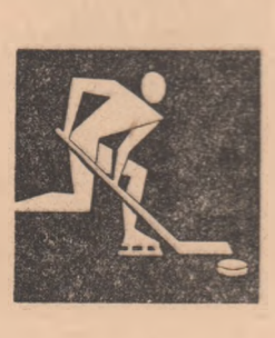
C. GRUIA-coresp. principal

4. Cooperatorul 16 5 0 11 63- 97 10 5. Voinea 16 0 0 16 35-165 0 Echipa clasată pe primul loc, Tirnava Odorheiului Secuiesc (antrenor Ernest Tîrnău), a disputat un meci de baraj pentru promovare cu formația ce va ocupa ultimul loc în clasamentul diviziei A, care se reia cu ultima manșă miercuri, tot pe patinoarul din Polana.