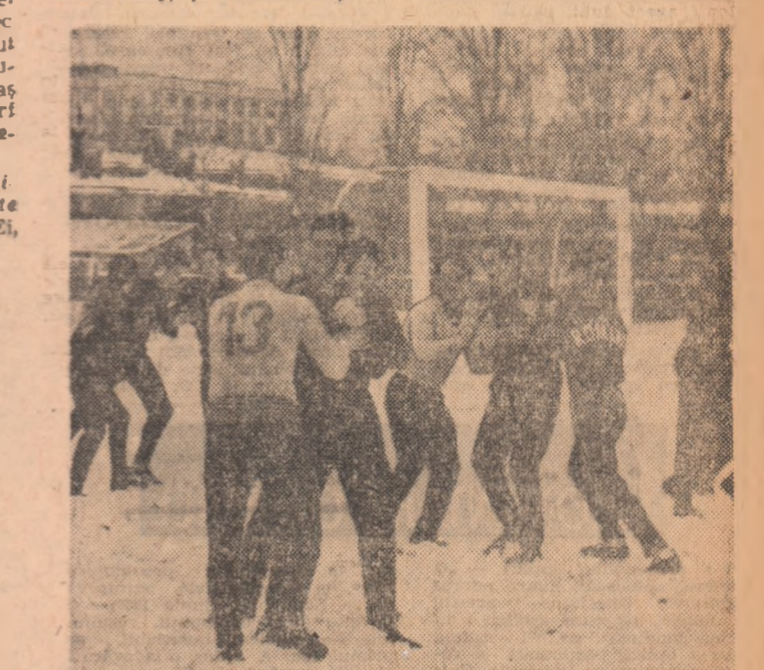
Ultimele „scenete” ale încălzirii... Antrenorul C. Drăgușin susține că marea majoritate a metrelor folosite la încălzire sînt „made in Manchester United”. De-ar fi de bun augur!