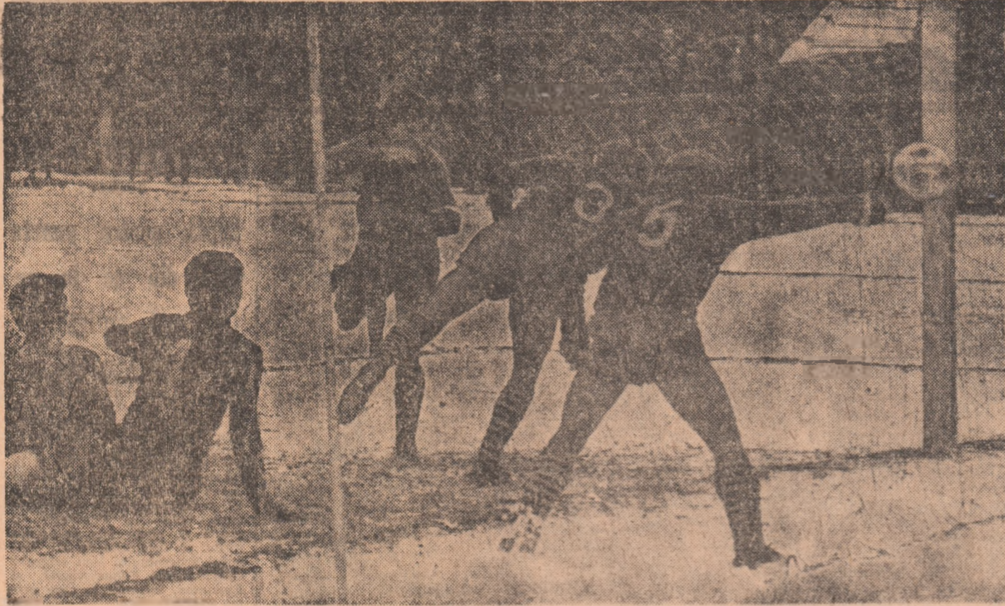
Cinci jucători, cinci atitudini și... un gol. Așa a deschiș scorul Dinamo Bacău în partida cu Progresul.