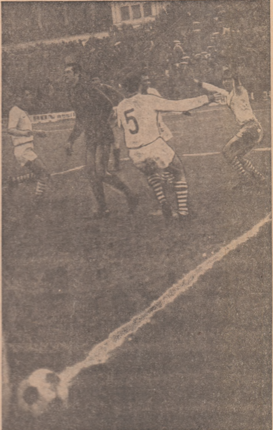
Moment 50: Dumitrache a inserat magistral primul gol al echipei sale și, în curînd, ca primii gratulațiile coechipierilor săi

1 Cred că, în prima fază, antrenamentul tînărului atlet trebuie să fie axat pe pregătire fizică generală, pe activitatea atletică multilaterală. După această fază — care ar trebui să dureze, după opinia mea, doi ani — elevii ar trebui să fie repartizați pe grupe alcătuite pe probe. Consider, însă, că la ora actuală, adică în condițiile exist-