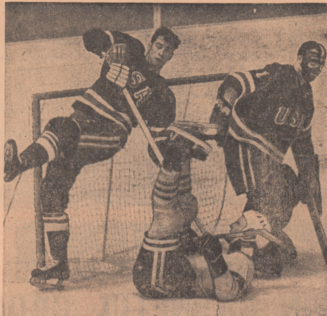
Acrobacie pe patine. Uffe Stener, hocheistul nr. 1 al selecționatului suedez, plonjează spectaculos între Mike Curran și Larry Pleu, din echipa S.U.A. Dar puțul nu a ajuns în plasă