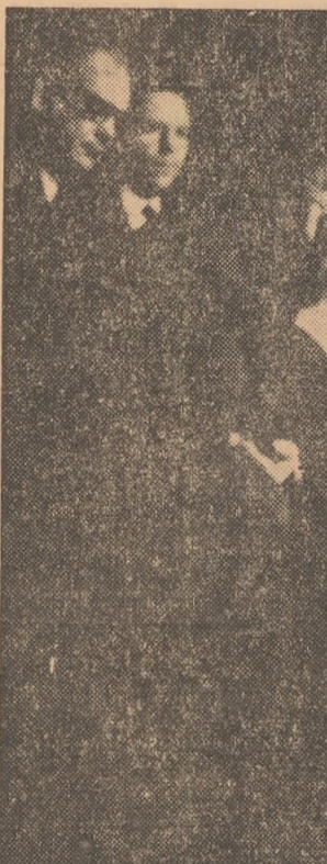
Ion Popa: De unde mai scot o echipă pentru campionatul european?

Cronici redactate de: ROMEO CALARAȘANU, PAUL IOVAN și GHEORGHE ILIUTA.