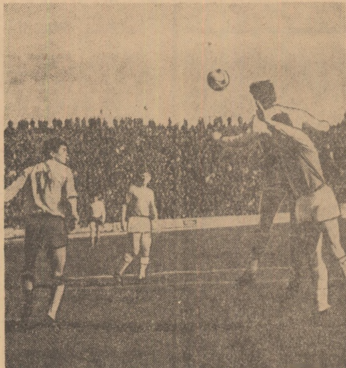
Genat de Alexici, Domide nu va putea utiliza centrarea, înaltă, în careu Foto: E. ROBCSEK — Timișoara

poate reduce numai la scheme. Să zicem, să cădem de acord, că această defecțiune de ordin tactic va fi reparată în timp util cu prilejul următoarelor jocuri-scoală (duminică lotul A se antrenează la Snaagov în compania echipei de tineret a Progresului) și că Ghergheli își va îndeplini obligațiile ce-i revin — în ambele situații ale jocului — pe importanta „perpendiculară” Boc—Ghergheli—Dembrovski (sau jucătorul care va fi desemnat în acest rol, la Atena). Sărbătorul care va fi desemnat în acest rol, la Atena). Sărbătorul care va fi desemnat în acest rol, la Atena). Sărbătorul care va fi desemnat în acest rol, la Atena).