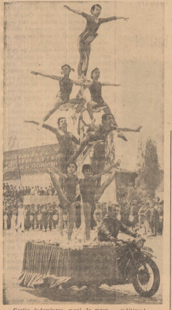
Grație, îndemnare, curaj, la mare înălțime!

ții de acrobatic pe motociclete și exerciții executate de sportivii clubului Olimpia. Își fac apariția reprezentanții clubului Dinamo, unul din cluburile fruntase din țară, care a dat mișcării noastre sportive, în cei peste 20 de ani de activitate, sute de performanțe, tineri care ne-au reprezentat cu cinste în mari întreceri.