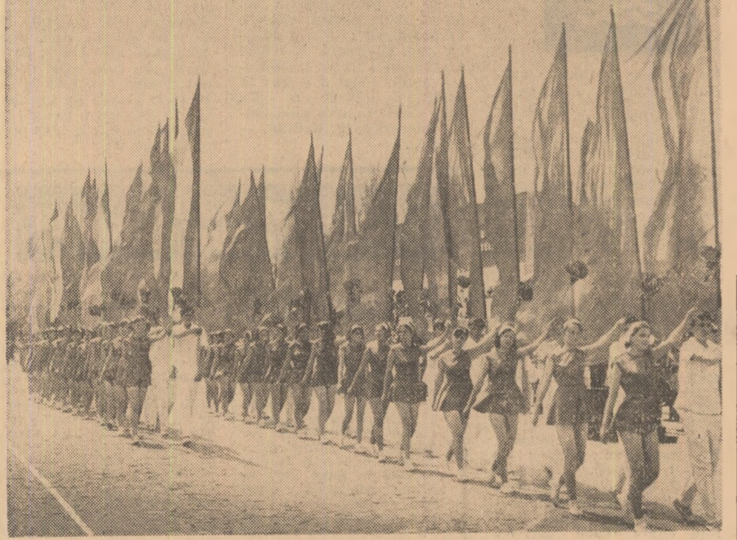
Superba simetrie a steagurilor...