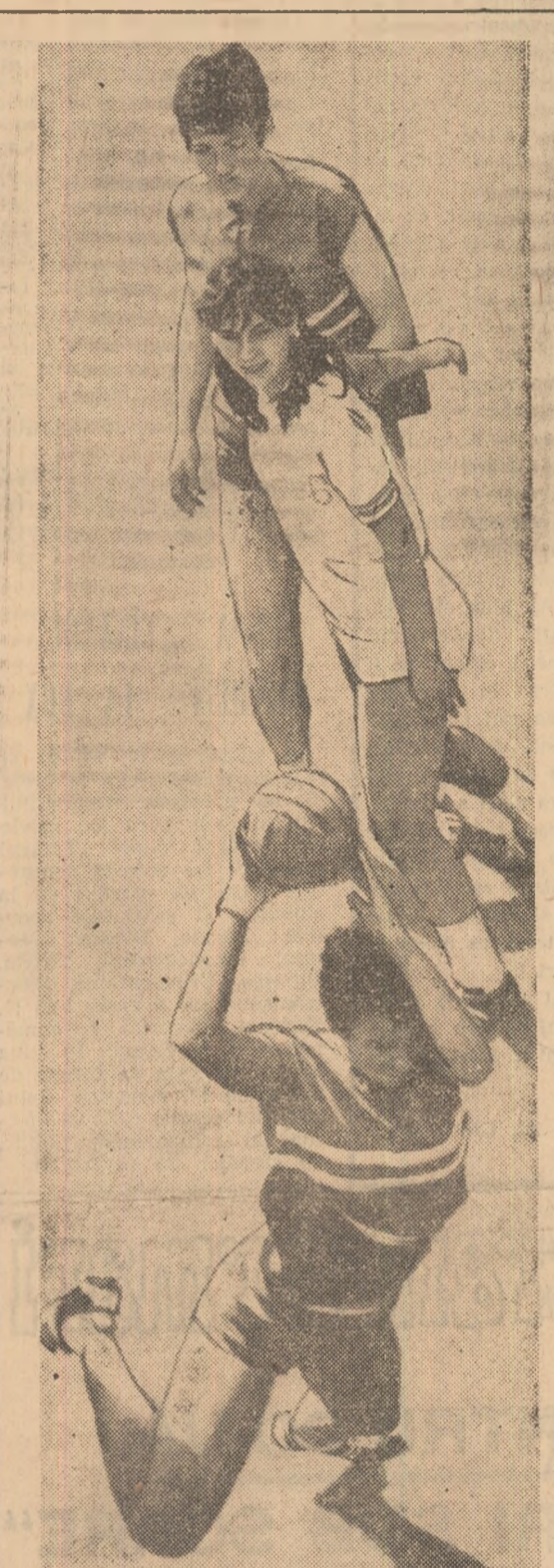
Handbal ... pe verticală. (Fază din meciul Consecția București — Rușmentul Brașov).

● Finala campionatului republican de juniori în XV se va disputa duminică 23 mai, în Capitală. Finaliste — echipele Grivița Roșie (antrenor Th. Rădulescu) și Clubul sportiv școlar (antrenor, Cornel Munteanu).