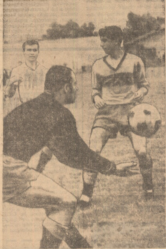
Portarul Mnsat (Flacăra roșie), protejat de un fundaș, va reține un șut periculos. (Fază din meciul Flacăra roșie București - I.M.U. Medgidia 1-1).