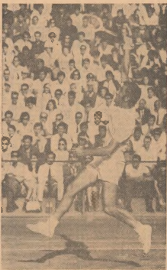
Ion Tiriac in plin atac

Și ultimele două partide de simplu din întâlnirea de tenis România — Israel au revenit jucătorilor noștri. Superioritatea manifestată și mai pregnant de către cei doi tenismeni români, Ion Tiriac și Ilie Năstase. Evoluțiile lor de ieri după amiază s-au ridicat adevărat la nivelul unor adevărate demonstrații de virtuozitate, certificând că primele noastre rachete cunosc o marcantă ascensiune de formă. O promisiune și pentru viitor, deosebit de încurajatoare acum, când ei pășesc într-una din etapele decisive ale marii competiții pe echipe a sportului alb.