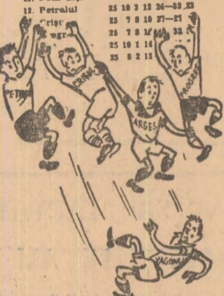
Desen de S. NOVAC