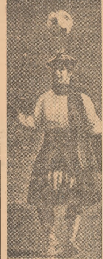
Gerd Müller (Bayern München) a fost în ultimele jocuri eroul reprezentativei R. F. a Germaniei, marcînd golurile decisive în partidele cu Scoția și Austria. Iată-l într-un echipament original, neobișnuit: un costum național scoțian, primit cadou la Glasgow.

În turneul de tenis din Berlin occidental: Ray Moore