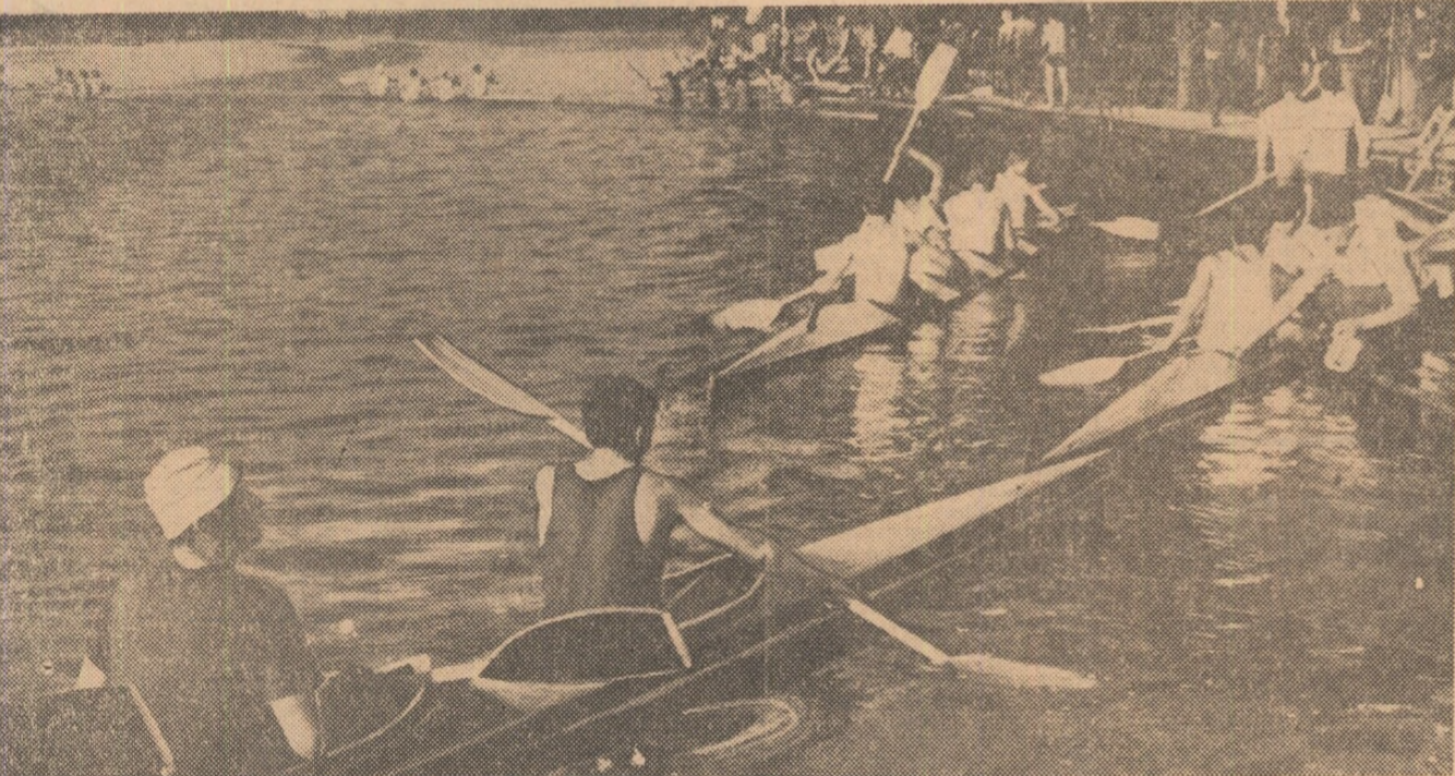
Snagorul, cu ape liniștite, și decor încântător, își primește zilnic oaspeții obișnuși — maeștri, dar și începători în sportul caiacului și canoiei