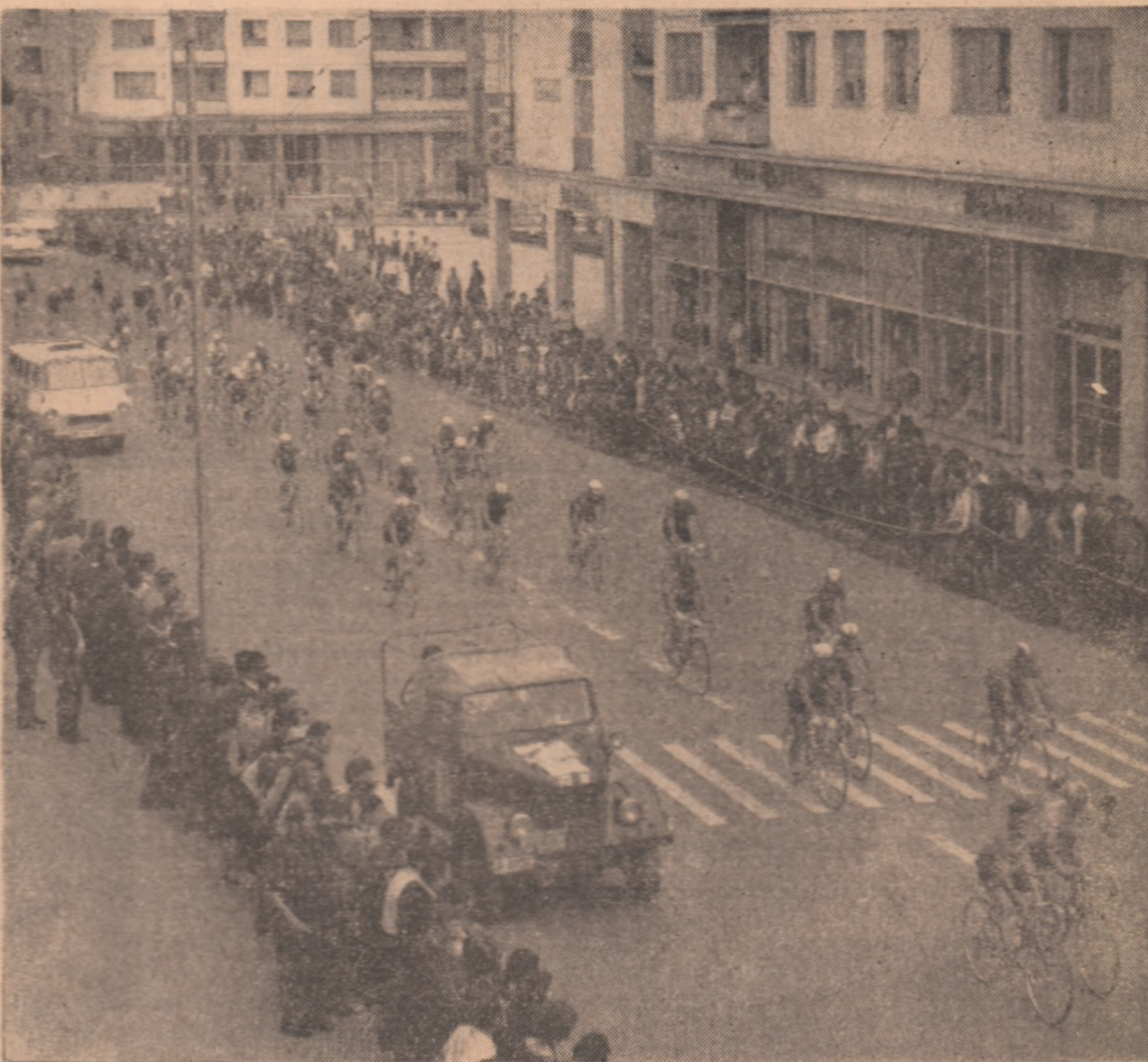
Cicliștii părăsesc vechea „Cetate de scaun” a Moldovei — Suceava

canșă Bucșoala, care au pădrit cele 14 clădiri — solarii (cu cîte un perete întreg de sticlă) și au ieșit în marginea comunei Prasin, cu pedagogii și instructorii lor, îmbrunși în tocmă ca floria care le încadrau brațele; și apoi mineri de la Iacobeni, căldării de minereu de mangan din mdrunțalele obștinilor bu-