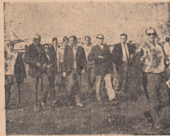
Poloștii din R. D. Germană, la cîteva momente după sosirea lor la aeroportul Băneasa.

● Oaspeții au sosit ieri în Capitală ● Programul celor două jocuri a fost modificat