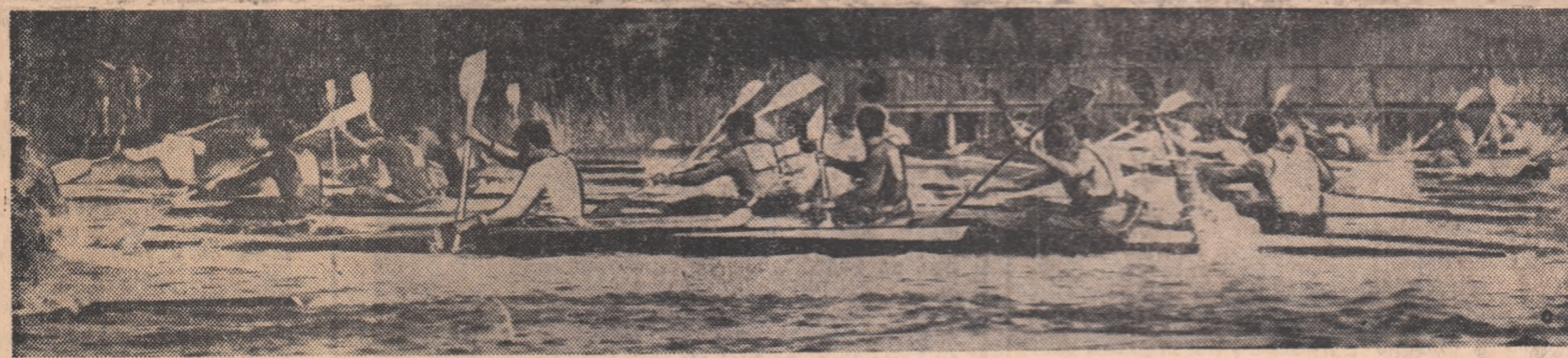
Pe Snagov, în aceste zile...