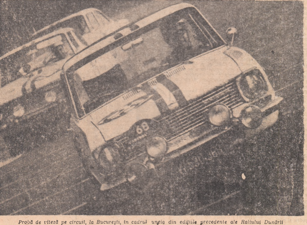
Probă de viteză pe circuit, la București, în cadrul unuia din edițiile precedente ale Raliului Dunării

Sportivetele cehoslovace sînt prezente pentru a doua oară la „Cupa Mării Negre”. Debutul l-au făcut în 1963, cînd au cucerit locul I, fiind urmate de România, Bulgaria și Franța. Selecționata Cehoslovaciei vine la Constanța după o serie de prestigioase victorii obținute în turneele de la Messina, Ragusa și San Remo, unde a cucerit, de fiecare dată locul I în compania echipelor Franței, României și Italiei și a suferit o singură înfrîngere în fața baschetalistelor noastre (50-54, la San Remo). În perspectivă, o revanșă așteptată cu deosebit interes. Despre Cehoslovacia mai trebuie spus că are un palmares impresionant, sintetizat în faptul că din anul 1930 și pînă în 1966 a fost permanent printre premiatele cu argint sau bronz ale campionatelor europene.