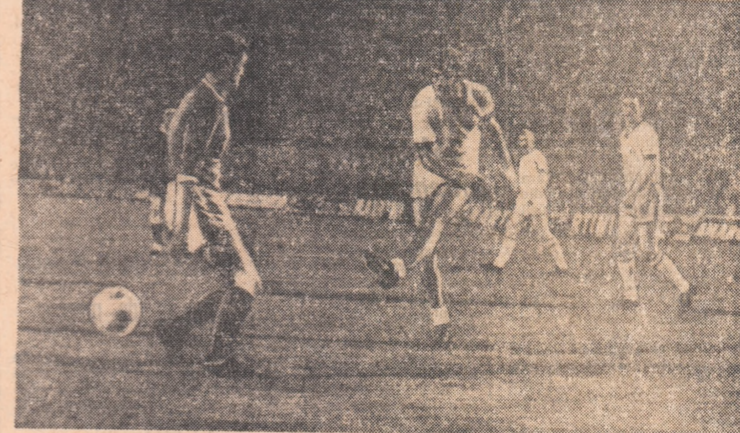
Așa a deschis „bombardierul” mijanez Prati drumul spre victorie în C.C.E. marcînd primul gol în poarta lui Manchester United, în semifinala de pe San Siro.

„Dacă am fi achiziționat pe Bulgarelli sau mai bine zis dacă Bologna n-l-ar fi cedat, cred că am fi avut jumătate din „scudetto” în buzunar. Așa însă...”.