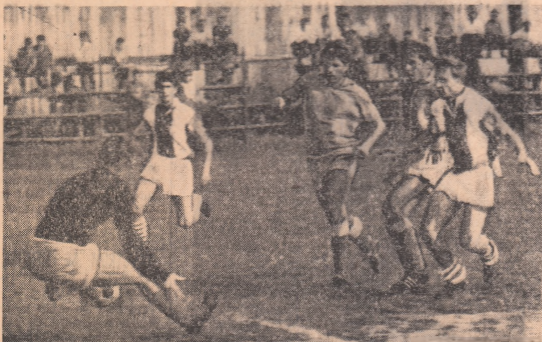
Șoangher ratează din nou o ocazie favorabilă FOTO: T. MACARȘCHI

Se spune, și se pare că așa stau lucrurile, că Bencică a avut un final de sezon ca în zilele și de gelozie, determinînd pe Otto Gloria să refacă echipa națională pe scheletul formației campioane. Veți urmări din timp jocurile viitorilor noștri adversari? - Firește. Ne-am găndit ca la 17 septembrie, cînd Rapidul va face deplasarea la Seftal, un observator român să însoțească formația feroviară și să mai rămînă câteva zile pe pămînt portughez; ca fi urmări, de asemenea, și jocul Grecia - Elveția, care se va desfășura la Atena în ziua de 15 octombrie. Așa înct, după cum se observă, pentru a nu se rata calificarea în turneul final al campionatului mondial, nu se pierde nimic din vedere. G. NICOLAESCU