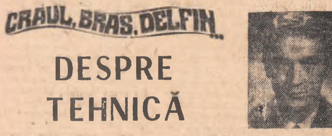
CRĂUL BRAS. DELFIN