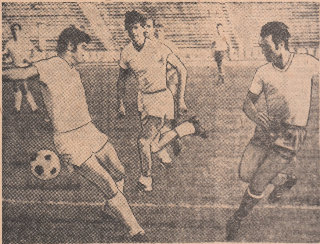
Tufan a pătruns în careu și a pasat printre doi adversari unui coechipier

Aproximativ 2000 de spectatori au fost prezenți ieri în tribunele de la „23 August” pentru a urmări prima acțiune de toamnă a lotului reprezentativ, aliat înaintea celui mai important sezon fotbalistic din ultimii ani.