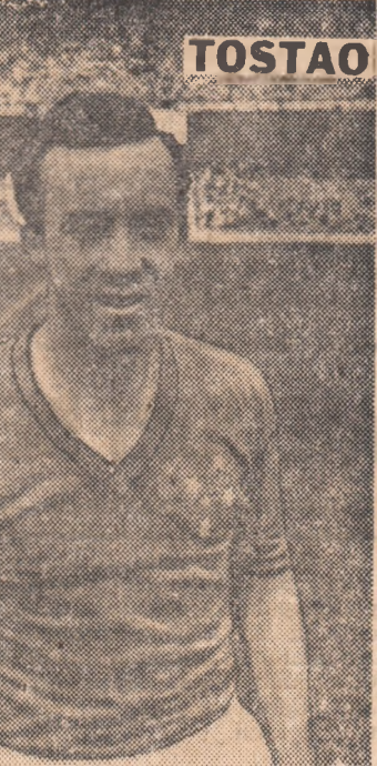
A ÎNCEPUT CAMPIONATUL FRANȚEI

Cunoscutul jucător scoțian Denis Law , care activează la Manchester United , este din nou indisponibil. Celul victoriei a fost înscris în minutul 43 de Herhadze .