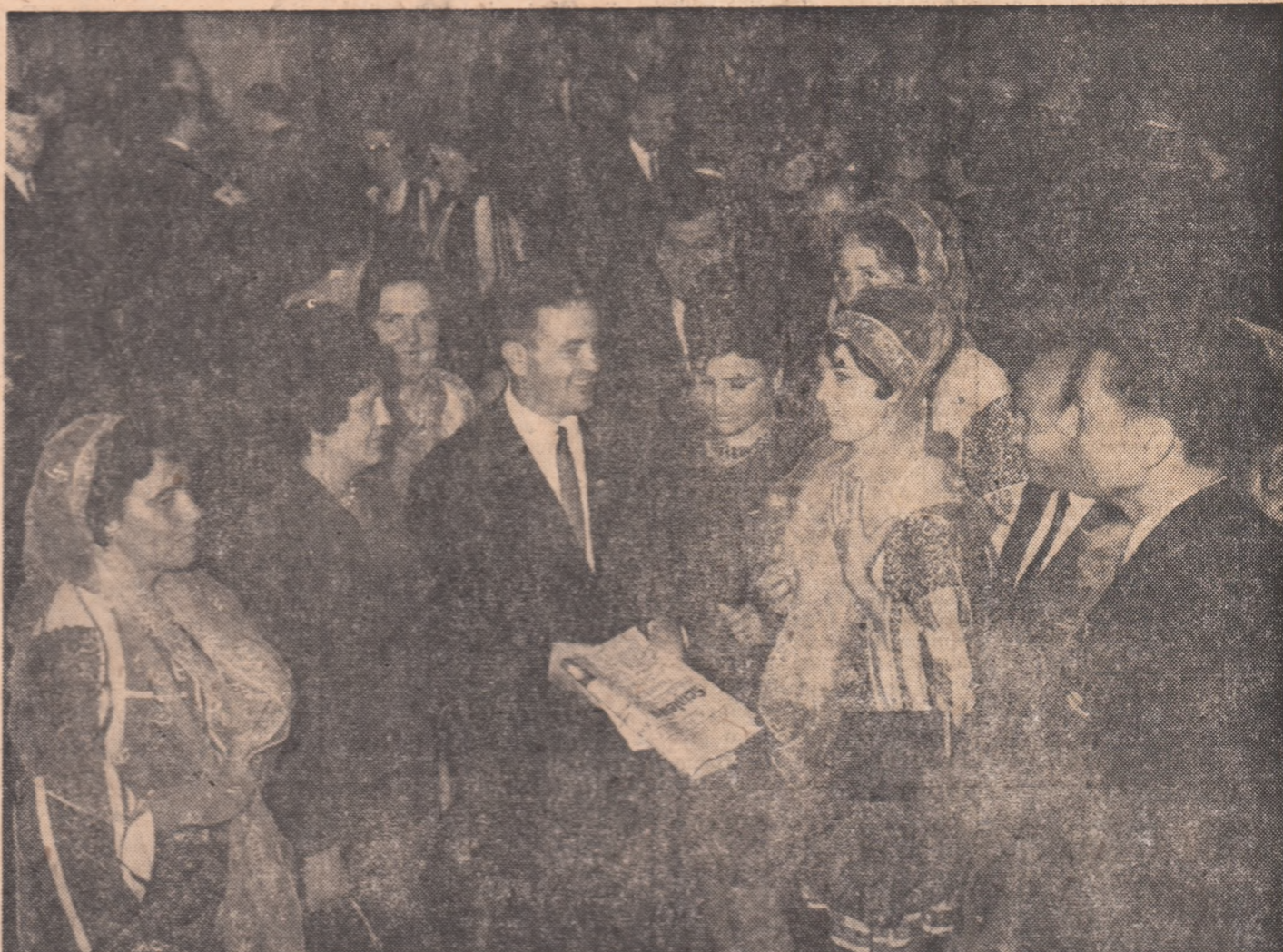
Un grup de delegați la Congres, într-o pauză