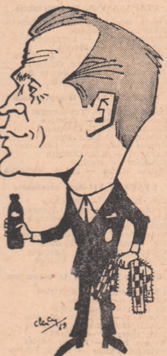
GH. COBZUC văzut de AL. CLENCIU

— Foarte buni. Tocmai în aceasta constă plusul lor de forță arătat în ultimele meciuri. Cobzuc și Țiriac care se face între ei, în special în partidele de dublu, este o armă redutabilă pe terenul de joc. Cred că nu trebuie ascuns faptul că nu prea de mult, acești doi jucători erau depărtați sufletește unul de celăl-